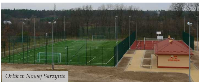
Orlik w Nowej Sarzynie

W okresie wakacyjnym rozpoczęto budowę kanalizacji sanitarnej w Judaszówce i na Osiedlu Janda w Nowej Sarzynie. Zadanie realizowane jest w ramach projektu „Uporządkowanie gospodarki wodno-ściekowej na terenie gminy Nowa Sarzyna”, który obejmuje wykonanie kanalizacji, przepompowni ścieków w Judaszówce oraz remont Stacji Uzdatniania Wody w Jelnej. Wartość inwestycji wynosi 4 243 423 zł. Prace potrwają do września przyszłego roku.