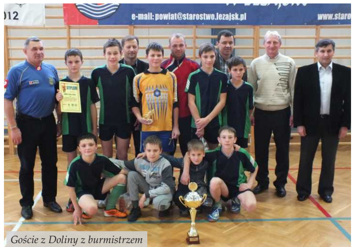
Goście z Doliny z burmistrzem