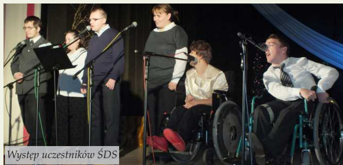
Występ uczestników ŚDS

9 grudnia br. w sali widowiskowej Ośrodka Kultury w Nowej Sarzynie, zgromadzona publiczność miała okazję wysłuchać najpiękniejszych, polskich pieśni religijnych, stanowiących doskonały przykład żywego przekazu naszej kultury muzycznej. Wśród bogatego repertuaru znalazły się tradycyjne pastorałki, które wprowadziły przyjazną, świąteczną atmosferę. Na scenie zaprezentowali się: dzieci z Przedszkola Samorządowego Nr 1 oraz „Niezapominajka w Nowej Sarzynie”, uczestnicy Środowiskowego Domu Samopomocy w Sarzynie, chóry