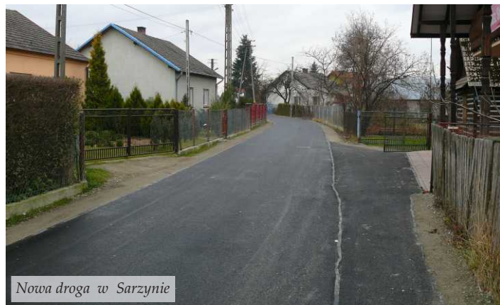
Nowa droga w Sarzynie

Nową nawierzchnię o długości 360 m wykonano w Rudzie Łańcuckiej za Domem Strażaka. Asfalt położono także na dwustumetrowym odcinku drogi gminnej z Woli Zarczyckiej do przysiółka „Budy”. Przebudowano nawierzchnię drogi na działce 351 „Zagumiennej” w Wólce Łętowskiej za kwotę przeszło 33 000 zł. Nowy „dywanik” długości 743 m powstał również w Sarzynie na działce o nr ewid. 1117. Obok drogi wybudowano chodnik o długości 338 m. Wartość inwestycji wyniosła blisko pół miliona złotych. W tej samej miejscowości przebudowano także, za kwotę 146 421 zł, nawierzchnię drogi gminnej nr 10755R o długości 633 m. W listopadzie wykonano również ponad półkilometrowy odcinek drogi gminnej „Piaski – Łaski” w Jelnej o wartości 153 552 zł.