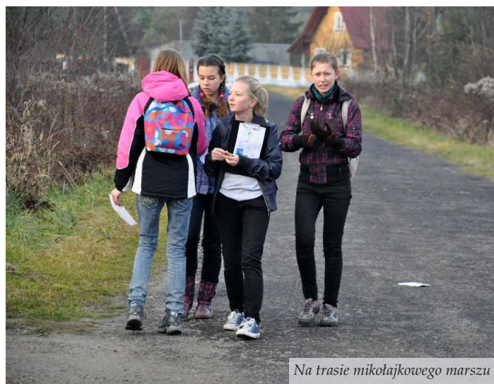
Na trasie mikołajkowego marszu