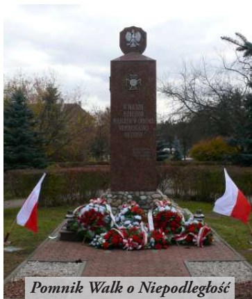
Pomnik Walk o Niepodległość