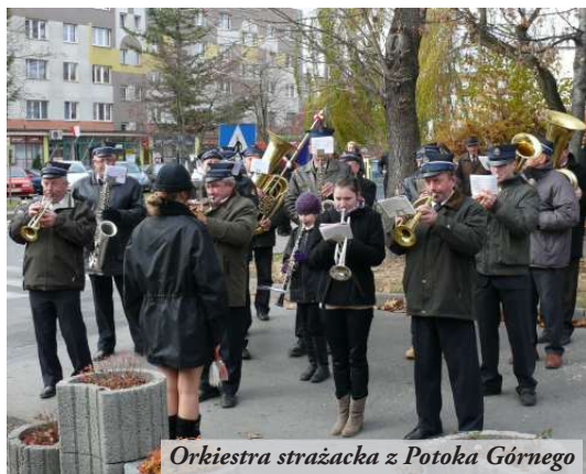
Orkiestra strażacka z Potoka Górnego