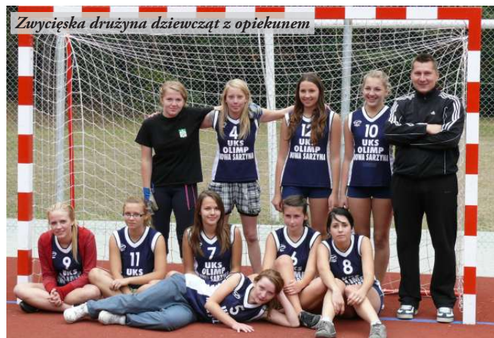
Zwycięska drużyna dziewcząt z opiekunem