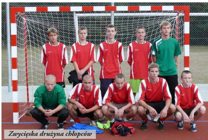
Zwycięska drużyna chłopców

Coca-Cola Cup to największy turniej piłkarski dla młodzieży w Polsce. W pierwszej rundzie zawodów, które odbyły się 7 października br. na boisku wielofunkcyjnym przy Zespole Szkół w Nowej Sarzynie wzięli udział gimnazjaliści z terenu powiatu leżajskiego oraz z Krzeszowa. Mecze drużyn chłopców i dziewcząt rozgrywane były systemem „każdy z każdym”. Sporym zainteresowaniem wśród kibiców – licealistów cieszyła się rywalizacja piłkarek, które bardzo żywo reagowały na boiskowe wydarzenia.