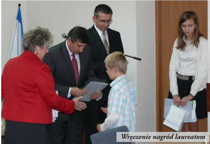
Wręczenie nagród laureatom