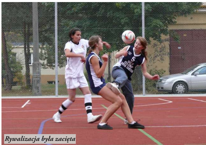
Rywalizacja była zacięta

Coca-Cola Cup to największy turniej piłkarski dla młodzieży w Polsce. W pierwszej rundzie zawodów, które odbyły się 7 października br. na boisku wielofunkcyjnym przy Zespole Szkół w Nowej Sarzynie wzięli udział gimnazjaliści z terenu powiatu leżajskiego oraz z Krzeszowa. Mecze drużyn chłopców i dziewcząt rozgrywane były systemem „każdy z każdym”. Sporym zainteresowaniem wśród kibiców – licealistów cieszyła się rywalizacja piłkarek, które bardzo żywo reagowały na boiskowe wydarzenia.