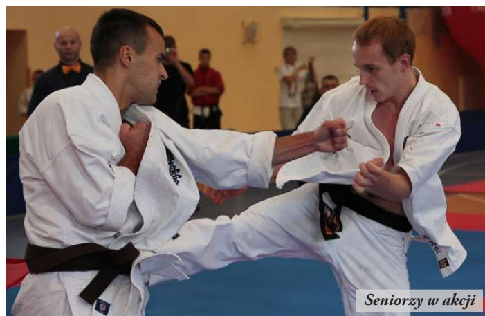
Seniorzy w akcji