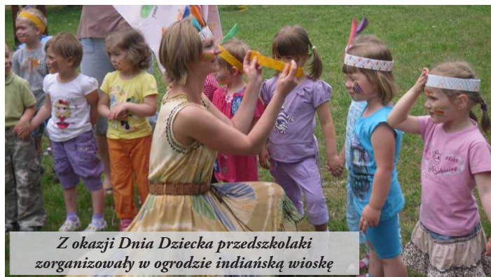
Z okazji Dnia Dziecka przedszkolaki zorganizowały w ogrodzie indyjską wioskę