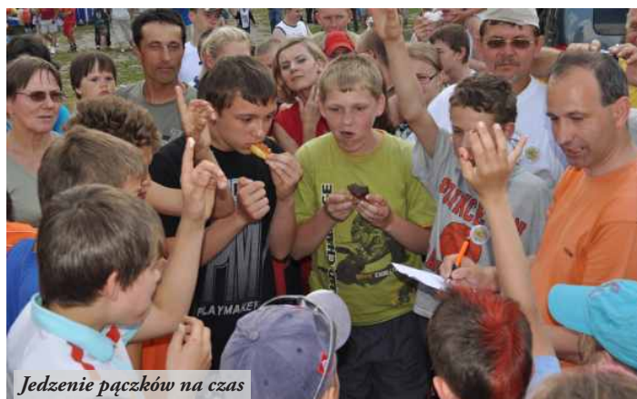
Jedzenie pączków na czas

22 maja odbył się już XXVII Zlot Azalia, którego organizatorem był Oddział PTTK w Nowej Sarzynie. Wytyczono trzy trasy: jedną pieszą z Nowej Sarzyny i dwie rowerowe z Leżajska i Nowej Sarzyny. Na miejsce zlotu dotarli również turyści z Rzeszowa i innych miejscowości Podkarpacia. Ośrodek Kultury przy współpracy Powiatu Leżajskiego zorganizował koncert finałowy na terenie ośrodka „Azalia” znajdującego się w sąsiedztwie najmniejszego w Polsce rezerwatu przyrody. Na program imprezy złożyły się konkurencje sprawnościowe, konkurs wiedzy o regionie o Puchar Burmistrza Miasta i Gminy oraz koncert amatorskich zespołów artystycznych działających na terenie gminy Nowa Sarzyna. Gwiazdą był Zespół Reprezentacyjny Związku Harcerstwa Polskiego „Wartaki”, który przyciągnął rzesze miłośników muzyki turystycznej.