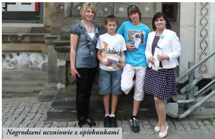
Nagrodzeni uczniowie z opiekunkami

20 maja 2011 r. w Centrum Edukacyjnym Instytutu Pamięci Narodowej im. Janusza Kurtyki w Warszawie odbył się ogólnopolski finał II edycji projektu edukacyjnego „Kamienie Pamięci – znajdź bohatera Sierpnia'80”, do którego zakwalifikowała się Szkoła Podstawowa im. Marii Skłodowskiej-Curie w Nowej