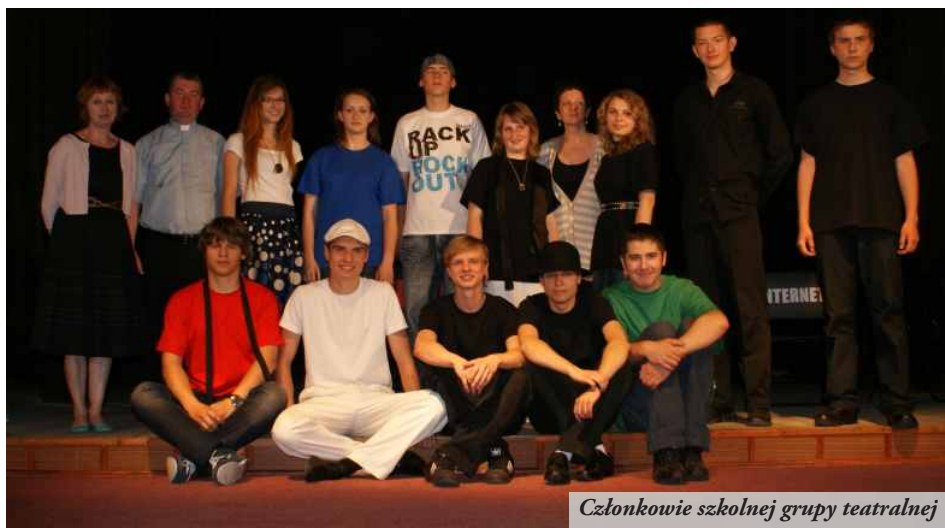
Członkowie szkolnej grupy teatralnej

24 maja 2011 na scenie Ośrodka Kultury w Nowej Sarzynie grupa teatralna uczniów Zespołu Szkół im. I. Łukasiewicza zrealizowała spektakl o tematyce profilaktycznej. Było to już drugie w bieżącym roku szkolnym przedstawienie, poprzednie miało miejsce w pierwszym półroczu, w okresie adwentowym.