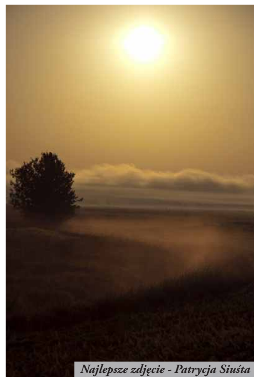
Najlepsze zdjęcie - Patrycja Siusta