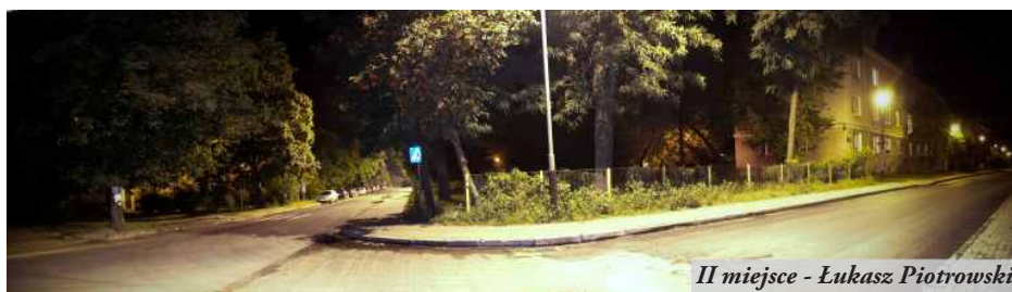
II miejsce - Łukasz Piotrowski