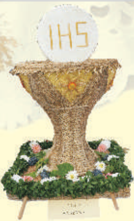
Wieniec z Sarzyny