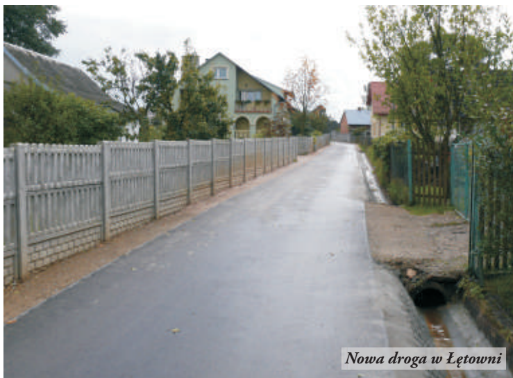
Nowa droga w Łętowni