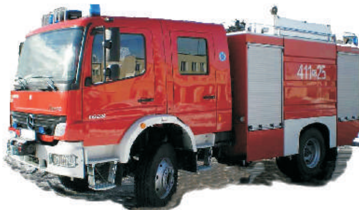
Takimi samochodami będą jeździć strażacy z naszej gminy