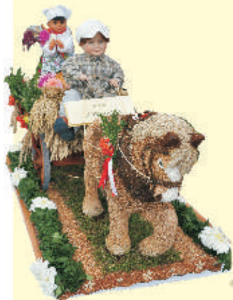
Wieniec z Tarnogóry