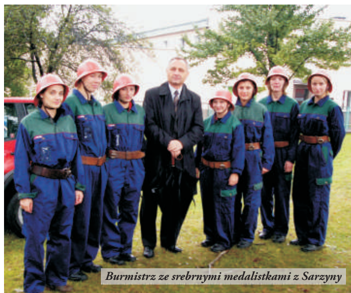
Burmistrz ze srebrnymi medalistkami z Sarzyny