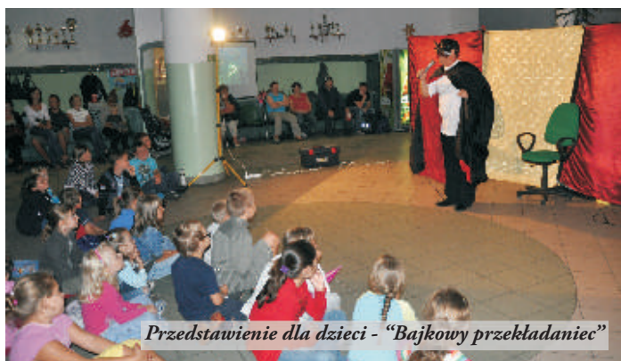
Przedstawienie dla dzieci - "Bajkowy przekładaniec"

Jak co roku Stowarzyszenie "Nasza Mała Ojczyzna", przy współpracy Miejskiego Ośrodka Sportu i Rekreacji, Stowarzyszenia Folklorystycznego "Majdaniarze", Ośrodka Kultury i Urzędu Miasta i Gminy w Nowej Sarzynie zorganizowało "Pożegnanie Wakacji". Nawet padający, od czasu do czasu, deszcz nie pokrzyżował planów organizatorów oraz nie wystraszył publiczności. Imprezę rozpoczęły zawody pływackie w 3 kategoriach wiekowych. I tak wśród najmłod-