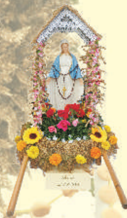
Wieniec z Łętowni