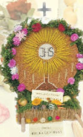
Wieniec z Wólki Łętowskiej