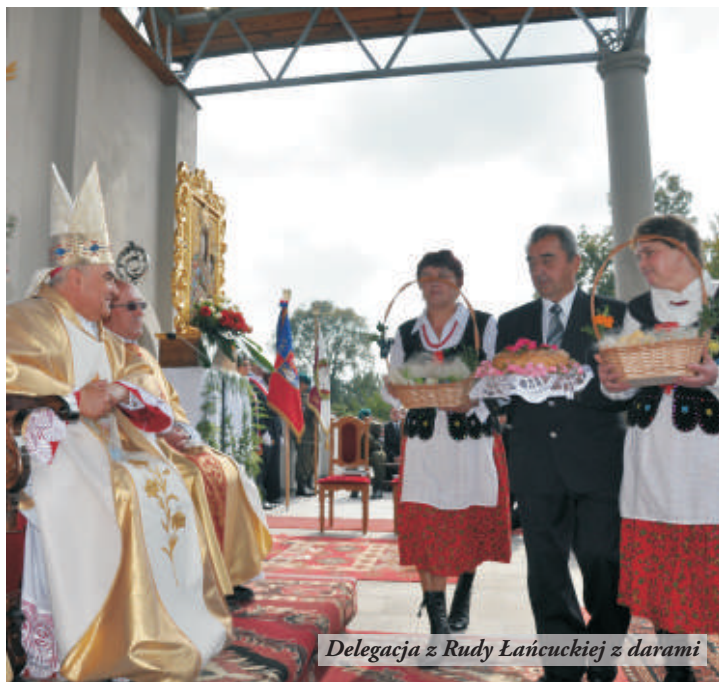
Delegacja z Rudy Łańcuckiej z darami