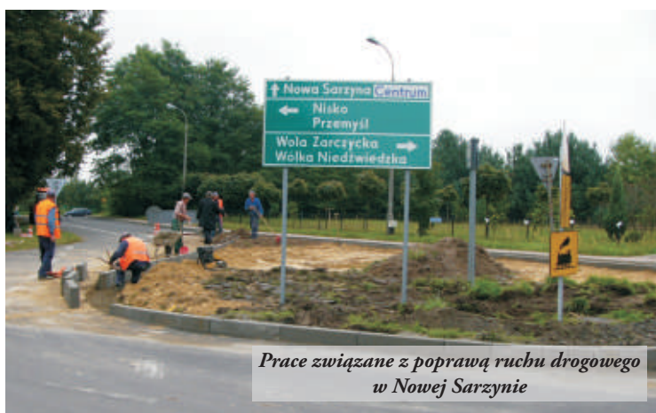
Prace związane z poprawą ruchu drogowego w Nowej Sarzynie