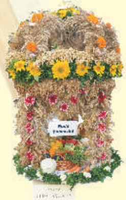
Wieniec z Rudy Łańcuckiej