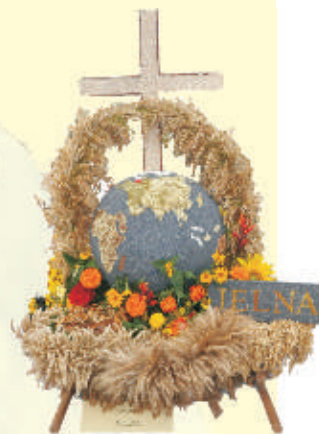
Wieniec z Jelnej