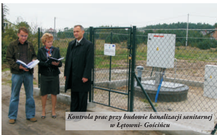
Kontrola prac przy budowie kanalizacji sanitarnej w Łętowni-Gościńcu