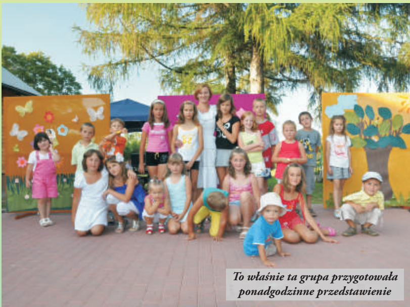
To właśnie ta grupa przygotowała ponadgodzinne przedstawienie