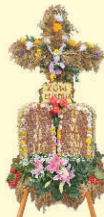
Wieniec z Łukowej