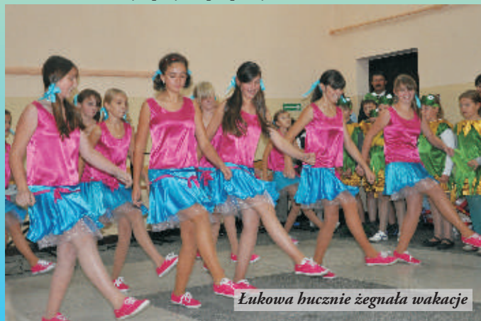
Łukowa hucznie zegnała wakacje