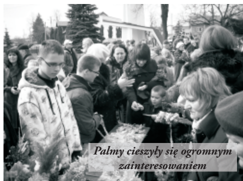
Palmy cieszyły się ogromnym zainteresowaniem