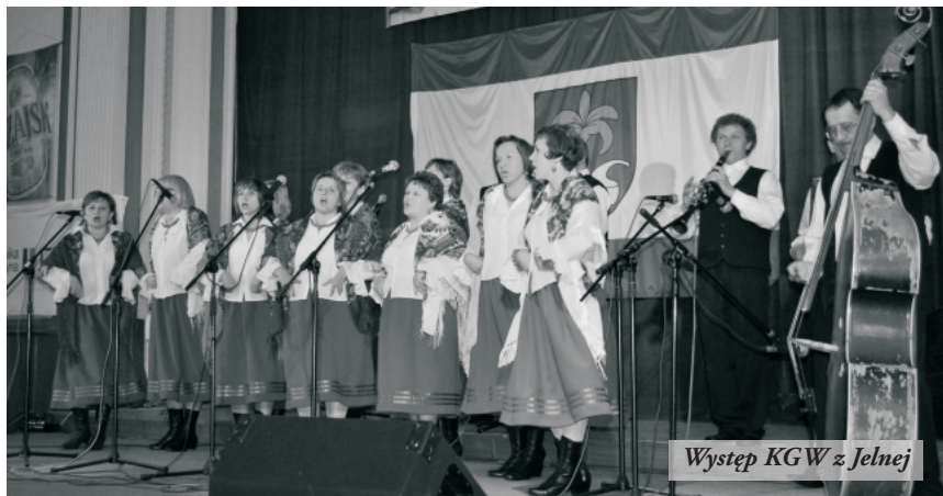
Występ KGW z Jelnej

i rogożyny, serwetki, koronki, haft oraz ceramikę ludową. Nowością były stoiska z ręcznie robioną biżuterią. Kwiaty, przede wszystkim misternie wykonane storczyki, można było także zobaczyć i kupić na stoisku koła plastycznego z Woli Zarczyckiej, prowadzonego przez pracownice filii Ośrodka Kultury oraz Miejskiej i Gminnej Biblioteki Publicznej. Odwiedzającym targi czas umilała kapela ludowa "Młoda Trzciana".