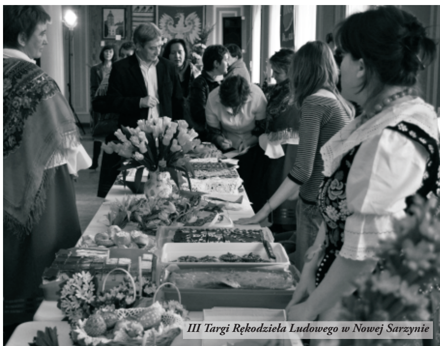
III Targi Rękodzieła Ludowego w Nowej Sarzynie

Pieczone baranki z ciasta, kolorowe pisanki, babki marmurkowe, ale także wyroby z minerałów i kamieni. To atrakcje, jakie czekały na wszystkich, którzy w niedzielę, 21 marca, odwiedzili Targi Rękodzieła Ludowego i Artystycznego.