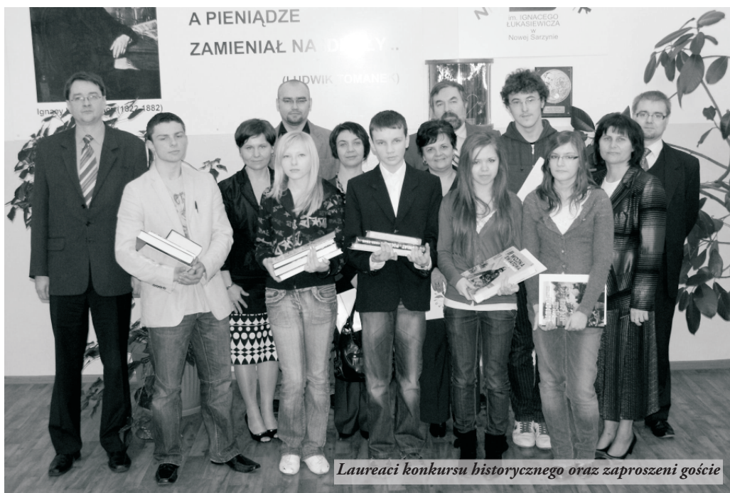
Laureaci konkursu historycznego oraz zaproszeni goście