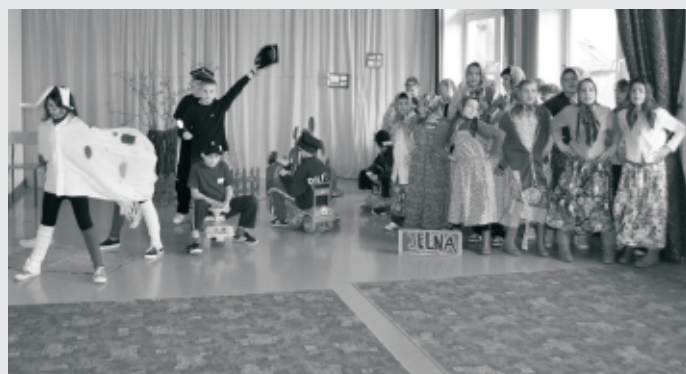
Zdjęcia pochodzą z imprez zorganizowanych przez Przedszkole Samorządowe nr 2 w Nowej Sarzynie, Szkołę Podstawową w Jelnej, Zespół Szkół w Sarzynie oraz Jerzego Charysza