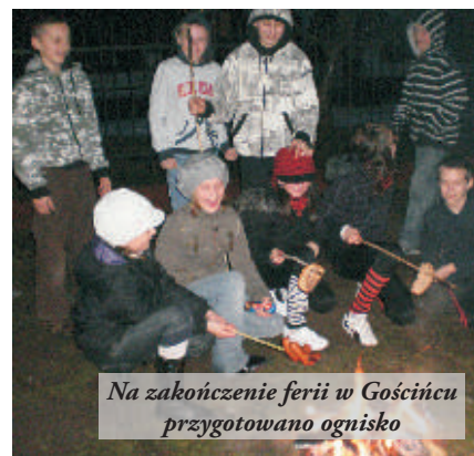
Na zakończenie ferii w Gościńcu przygotowano ognisko

W Ośrodku Kultury w Nowej Sarzynie wyświetlono filmy: "Epoka lodowcowa 3", "Wyspa dinozaura", "Lato muminików", "Noc w muzeum" i "Gwiazda Kopernika". Niemalą atrakcją okazała się "Dyskoteka Walentynkowa". Ponadto odbył się koncert hip-hopowej formacji "Raz, dwa, raz" z Nowej Sarzyny.