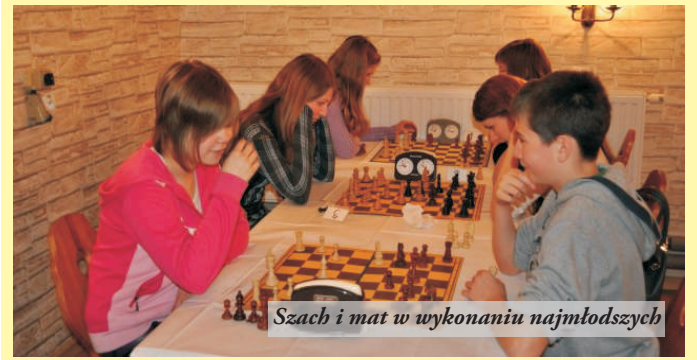
Szach i mat w wykonaniu najmłodszych