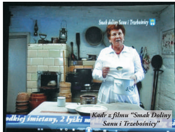
Kadr z filmu "Smak Doliny Sanu i Trzebońnicy"