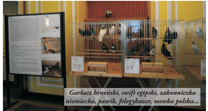
Garłacz brneński, swift egipski, zakonniczka niemiecka, pawik, felegyhazer, mewka polska...

W 2009 roku na tym odcinku zanotowano tylko 1 wypadek drogowy, bez ofiar śmiertelnych oraz 3 kolizje drogowe. Rekonstrukcja skrzyżowania ulic 1-go Maja, Komisji Edukacji Narodowej i Jana Pawła II w Nowej Sarzynie to przykład niezwykle trafnej inwestycji komunalnej, która daje wymierne korzyści – eliminowanie zagrożeń dla życia i zdrowia ludzkiego.”