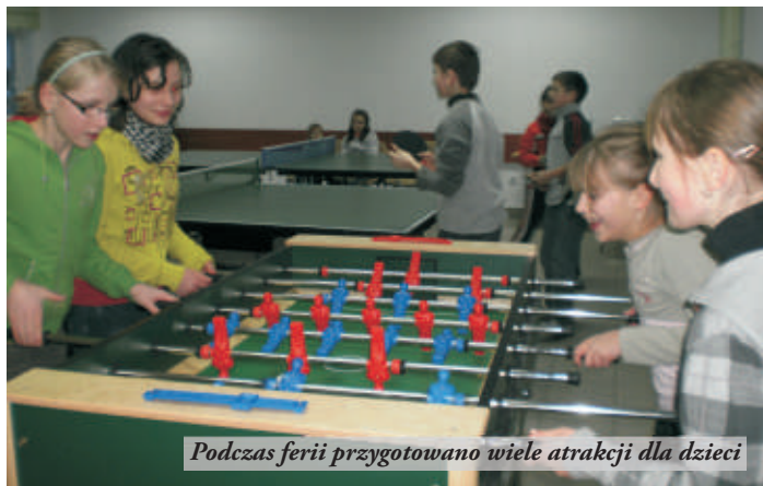
Podczas ferii przygotowano wiele atrakcji dla dzieci

Największym zainteresowaniem cieszyły się zajęcia sportowe: gra w halową piłkę nożną, piłkę siatkową, mini-koszykówkę. Uczestnicy mogli również poznać przepisy gier i zasady sędziowania, doskonaląc elementy techniczne i taktyczne, nauczyć się gry zespołowej i przestrzegania zasady "fair play" oraz podstawowych sposobów udzielania pierwszej pomocy. Aspekt wychowawczy zajęć, to pokazanie młodym ludziom jak budować i wzmacniać pozytywną samoocenę, jak rozwiązywać problemy związane z koncentracją uczeniem się, jak radzić sobie ze stresem, emocjami, jak rozwiązywać konflikty. Mówiono też o szkodliwości wszelkich uzależnień i niewłaściwych przyzwyczajeniach.