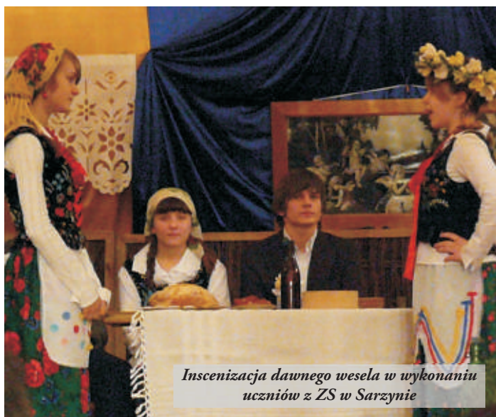
Inscenizacja dawnego wesela w wykonaniu uczniów z ZS w Sarzynie