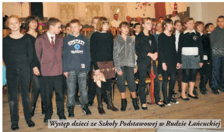
Występ dzieci ze Szkoły Podstawowej w Rudzie Łańcuckiej

6 marca 2010 r. w Domu Strażaka w Rudzie Łańcuckiej odbyła się impreza promocyjno-kulturalna pod hasłem "Cudze chwalicie, swego nie znacie". Organizatorem była Lokalna Grupa Działania Stowarzyszenie "Region Sanu i Trzebońnicy", przy współudziale Koła Gospodyń Wiejskich z Rudy Łańcuckiej. Celem naszej imprezy jest aktywizacja społeczności lokalnej, kultywowanie tradycji poprzez integrację pokoleń oraz wzmocnienie