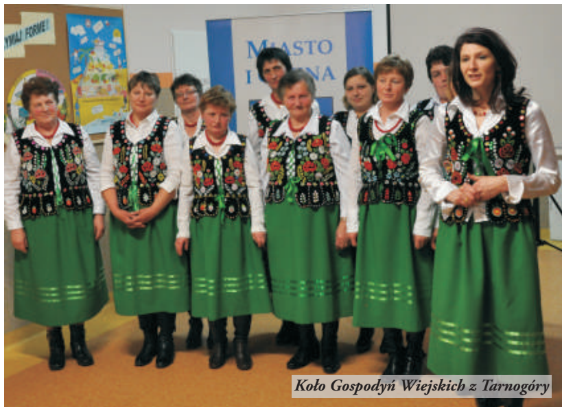
Koło Gospodyń Wiejskich z Tarnogóry

Podczas premiery, ze swoimi przyspiewkami, wystąpiły Koła Gospodyń Wiejskich z Rudy Łańcuckiej i Koziarni. Nie zabrakło również potraw regionalnych. Pomysł zrealizowania tego przedsięwzięcia zrodził się z potrzeby ocalenia zwyczajów, obrzędów, które w przeszłości jednoczyły społeczności wiejskie –