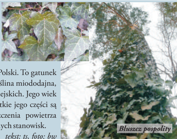
tekst: ts

Bluszcz pospolity ( Hedera helix L.) - rośnie m.in.: przy ul. Piłsudskiego w Nowej Sarzynie, gdzie oplata sosnę pospolitą do wysokości ok. 4 m. Szacunkowy wiek, to ok. 17 lat. Należy do rodziny araliowatych i jest jej jedynym przedstawicielem we florze Polski. To gatunek śródziemnomorsko – atlantycki, występujący prawie w całej Europie. Bluszcz jako roślina miododajna, lecznicza i kosmetyczna oraz cenna odmiana okrywowa, hodowany jest w parkach miejskich. Jego wiek może osiągać nawet 700 lat. Rośnie stosunkowo wolno. Należy pamiętać, że wszystkie jego części są trujące. Jest pnączem zimozielonym, cienioznośnym, odpornym na zanieczyszczenia powietrza dwutlenkiem siarki i pyłami. Od 1946 roku objęty ochroną prawną na terenie naturalnych stanowisk.