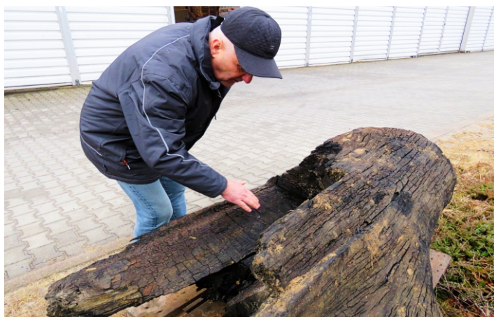
Pień czarnego dębu sprzed tysiąca lat z wydlubaną barcią, znaleziony w pradolinie Sanu. Obecnie w prywatnej kolekcji.

Bezcenna dla świata nauki barć-sarkofag z Sanu, trafiła do Muzeum Kultury Bartniczej w Augustowie. Jest w tej chwili najstarszym eksponatem tego typu w Polsce. „Zdetronizowała” znaną z 1901 r. tzw. barć odrzańską, datowaną „zaledwie” na X w.n.e. San w ostatnich latach stał się Eldorado dla poszukiwaczy prastarych barci. Całkiem blisko, bo w Leżajsku, na dziedzińcu Muzeum Ziemi Leżajskiej eksponowana jest ponadtysiącletnia kłoda dębowa z wydrążoną barcią. Niestety pustą. Podobny obiekt – także znaleziony w piaskach Sanu – jest do obejrzenia w Biszczy, w prywatnej kolekcji pasjonata pszczelarstwa i bartnictwa.