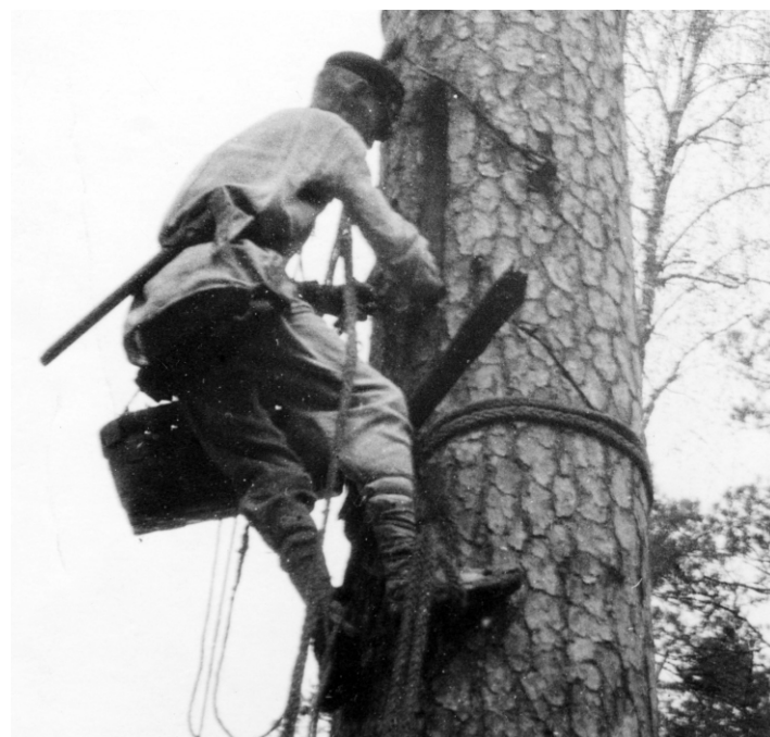
Sposób zakładania barci nie zmienił się przez wieki. Na zdjęciu bartnik z pocz. XX w.