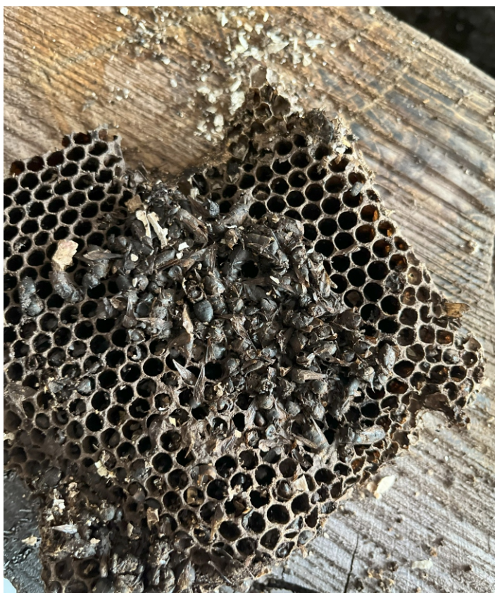
Material biologiczny sprzed 1300 lat zachowany w sarkofagu.