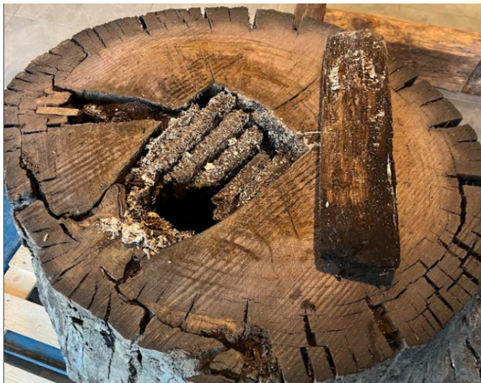
Barć-sarkofag z pradoliny Sanu, jest ewenementem na skalę światową, fot. Bractwo Bartne