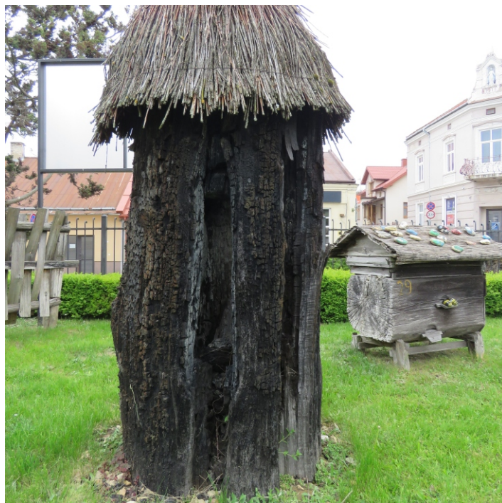
Kłoda czarnego dębu z barcią, tzw. stojak. Ekspонат Muzeum Ziemi Leżajskiej.

Bezcenna dla świata nauki barć-sarkofag z Sanu, trafiła do Muzeum Kultury Bartniczej w Augustowie. Jest w tej chwili najstarszym eksponatem tego typu w Polsce. „Zdetronizowała” znaną z 1901 r. tzw. barć odrzańską, datowaną „zaledwie” na X w.n.e. San w ostatnich latach stał się Eldorado dla poszukiwaczy prastarych barci. Całkiem blisko, bo w Leżajsku, na dziedzińcu Muzeum Ziemi Leżajskiej eksponowana jest ponadtysiącletnia kłoda dębowa z wydrążoną barcią. Niestety pustą. Podobny obiekt – także znaleziony w piaskach Sanu – jest do obejrzenia w Biszczy, w prywatnej kolekcji pasjonata pszczelarstwa i bartnictwa.