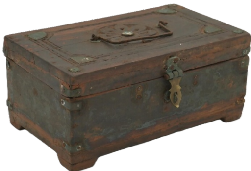
Szkatuła z kasą powstańców z 1863 roku od ponad 100 lat rozpala wyobraźnię poszukiwaczy skarbów