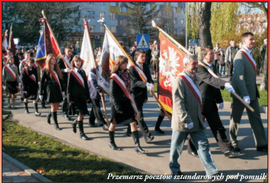
Przemarsz pocztów sztandarowych pod pomnik