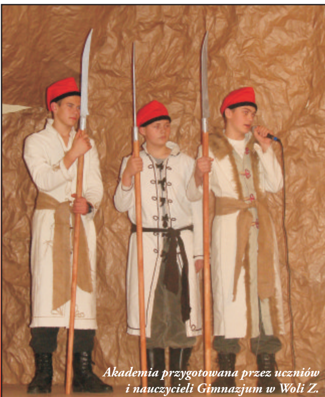
Akademia przygotowana przez uczniów i nauczycieli Gimnazjum w Woli Z.