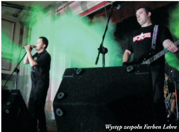
Występ zespołu Farben Lehre

Niespełna dwa tygodnie później, tj. w niedzielę 9 listopada, na scenie Ośrodka Kultury zagrał legendarny zespół punk rockowy Farben Lehre.