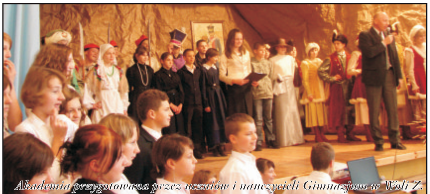
Akademia przygotowana przez uczniów i nauczycieli Gimnazjum w Woli Z.