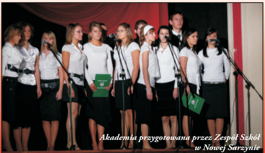
Akademia przygotowana przez Zespół Szkół w Nowej Sarzynie