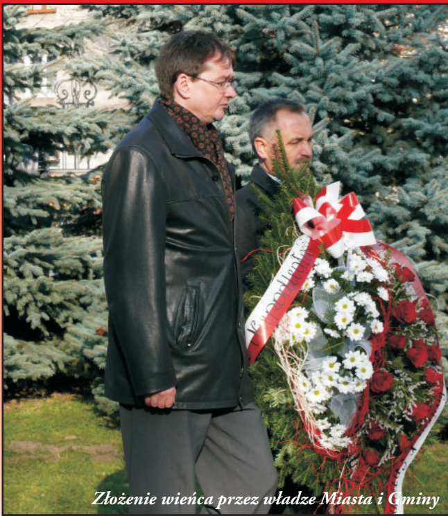
Złożenie wieńca przez władze Miasta i Gminy