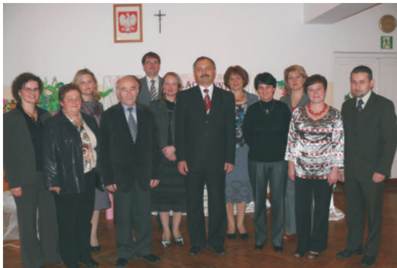
Władze Nowej Sarzyny z nagrodzonymi nauczycielami