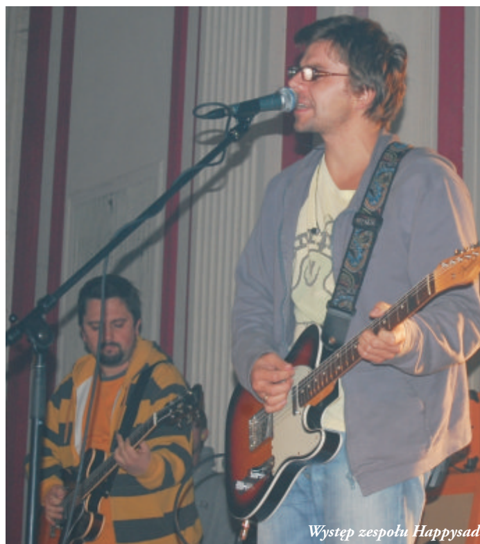
Występ zespołu Happysad

Jesienna trasa koncertowa „Długa Droga Tour” zespołu Happysad liczy 32 występy. Na tegorocznym szlaku ogólnopolskiej wędrówki grupy znalazły się 3 podkarpackie miasta. Obok Rzeszowa i Stalowej Woli, okazję goszczenia grupy miała Nowa Sarzyna, a konkretnie Happysad koncertował na scenie naszego Ośrodka Kultury w sobotę 25 października. Muzycy ze Skarżyska-Kamiennej swój występ rozpoczęli od utworu „Czysty jak łaźnia”, pochodzącego z ich debiutanckiej płyty zatytułowanej „Wszystko jedno”. Chwilę później zgromadzona publiczność bawiła się pod sceną przy największym przeboju z tej płyty pt. „Zanim pójdę”, który w 2004r. przez przeszło 30 tygodni nie schodził z Listy Przebojów Trójki Marka Niedźwieckiego. W międzyczasie zespół wziął na warsztat piosenki ze swoich kolejnych albumów studyjnych. Z wydawnictwa „Podróże z i pod prąd” usłyszeć można było m.in. „Słońce”, „Manewry Szczęścia”, czy też „Nostress”. Natomiast płyta „Nieprzygoda”, którą uważa się za najbardziej dojrzałą kompozycję zespołu, zaprezentowana została praktycznie w całości. Z takich utworów, jak „Milowy las”, „Długa droga w dół” czy „Jałowiec” uwidoczniła się cała esencja muzyki grupy, czyli energicznie, przebojowo, poetycko. Nie sposób było tej pozytywnej dawce energii się oprzeć. Najdobitniej świadczyła o tym żywiołowa reakcja zachwyconej publiczności, która z niepohamowanego wiru tańca, przechodziła do nastroju nostalgii