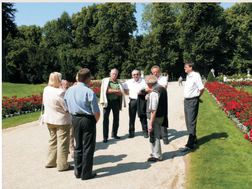
Wizyta delegacji w zamku w Łańcucie