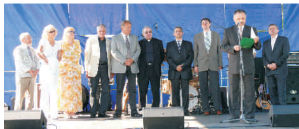
Powitanie zagranicznych delegacji oraz mieszkańców

Sponsorami imprezy byli: Zakłady Chemiczne „Organika-Sarzyna” oraz Browar w Leżajsku. Patronat medialny objęło Polskie Radio Rzeszów, GC „Nowiny” i Telewizja Kablowa „LokalTel”.