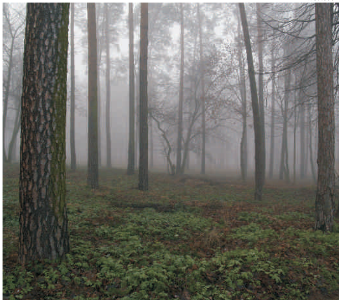
Zdjęcie Dariusza Żaka - II miejsce