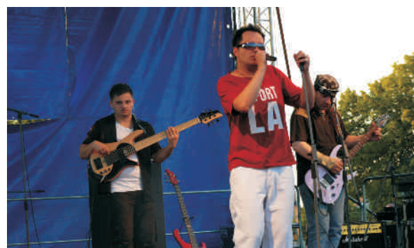
Występ zespołu Vir