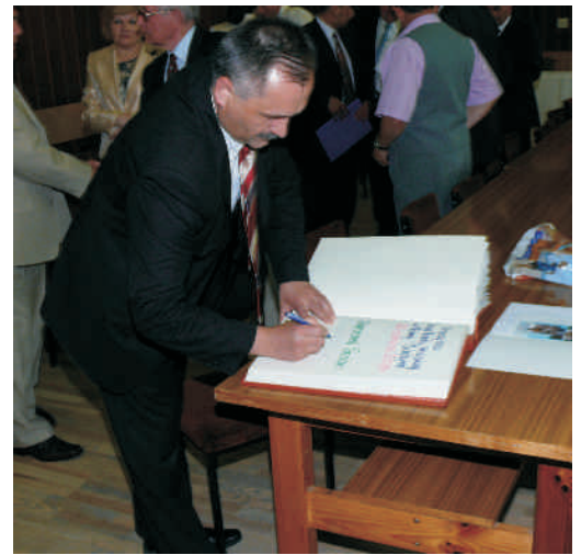
Burmistrz podpisuje Kronikę MiG

Zaproszeni goście i gospodarze obejrzeni film o naszej gminie, zrealizowany przez Nowosarzyńską Telewizję Kablową, zaś po zamknięciu obrad wpisali się do kroniki Miasta i Gminy.