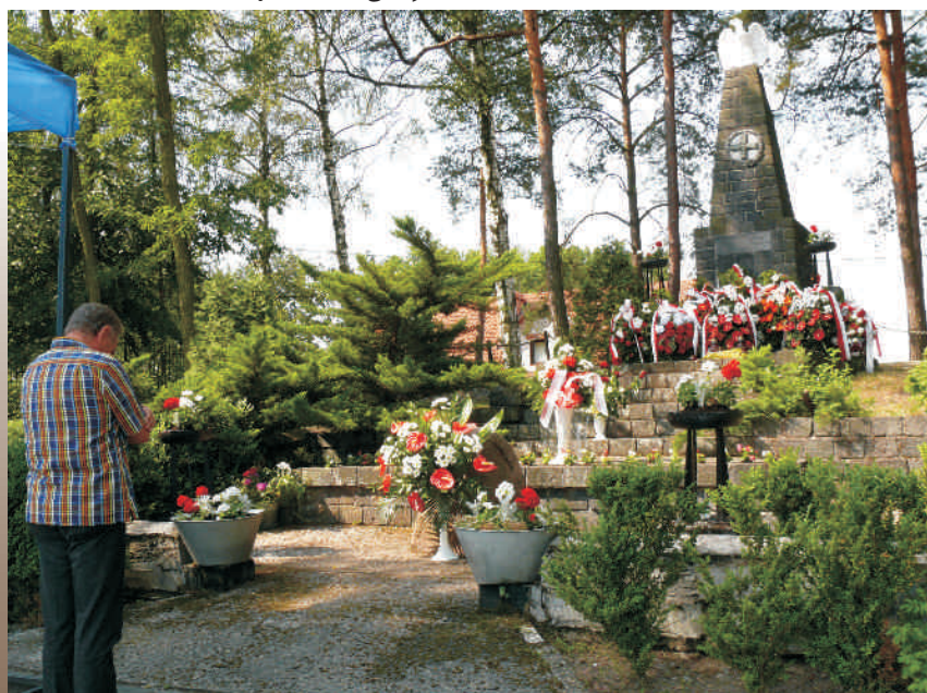
Burmistrz Klaus Linska składa hołd ofiarom pacyfikacji Woli Zarczyckiej