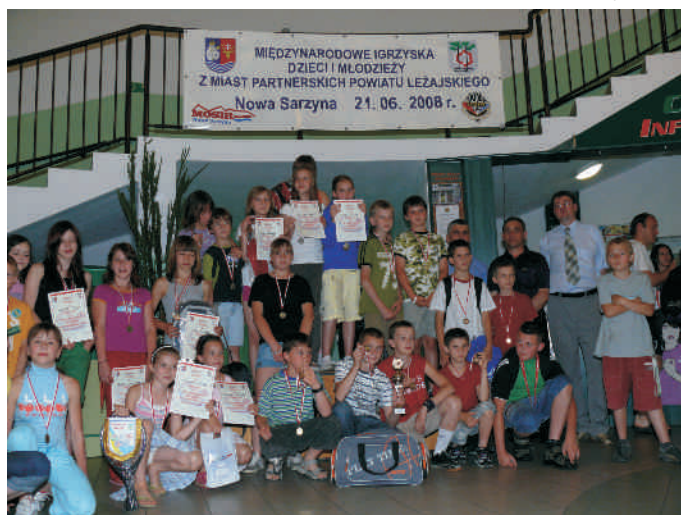
Nagrodzeni sportowcy oraz przedstawiciele władz Nowej Sarzyny, Powiatu Leżajskiego i miasta Dolina