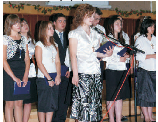
Występ młodzieży z Zespołu Szkół w Sarzynie