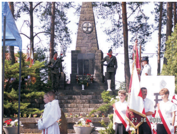
Warta honorowa przed pomnikiem ofiar pacyfikacji