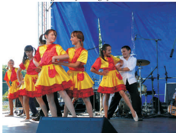
Występy zespołów z terenu MiG