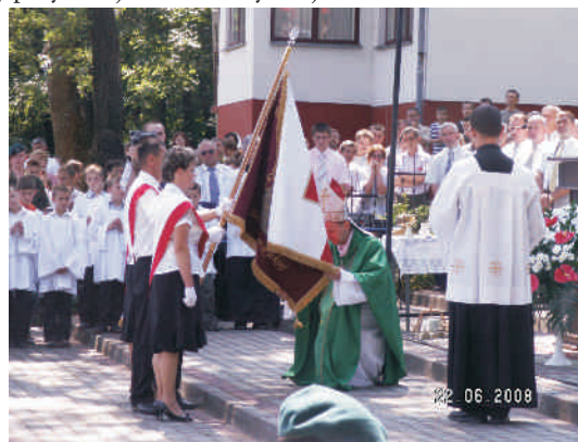
Poświęcenie sztandaru Gimnazjum w Woli Zarczyckiej