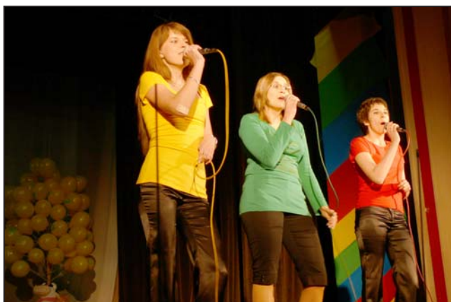
Występ zespołu OK na Sarzyńskiej Wiosnie

Tak wyglądały wyniki w poszczególnych konkursach: