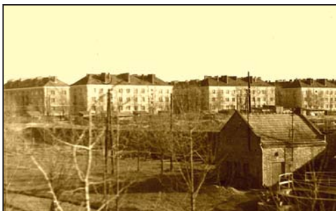
Bloki w Nowej Sarzynie

Po oczyszczeniu terenu w 1945 roku, fabrykę przejęły Zakłady Chemiczne Boruta w Zgierzu, które przed wojną były jej głównym udziałowcem. Zmieniono nazwę na Zakłady Związków Organicznych i przys-