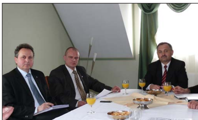
Burmistrz i Sekretarz z Dębicy oraz Burmistrz MiG Nowa Sarzyna