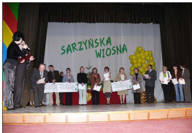
Zwycięcy akcji Drzewko za butelkę

Niestety przykrym stał się fakt, że publiczność złożona w większości z przedstawicieli placówek wychowujących nasze