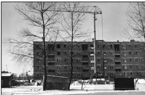
Budowa bloku przy ul. I-go Maja 1

Na terenie wytwórni utworzyli magazyn amunicji, w którym zmuszali do pracy okoliczną ludność. Okupacja i działania wojenne spowodowały wielkie straty. Zniszczeniu uległa elektrownia, budynki produkcyjne i mieszkalne, spaliło się 50 hektarów lasu. Niemcy opuścili Sarzynę w dniu 25 lipca 1944 roku, po ośmiogodzinnej walce z Armią Czerwoną. Pozostawili miny oraz resztki amunicji i materiałów wybuchowych. Z uwagi na zagrożenie, administrowanie zakładem objęło Wojsko Polskie.