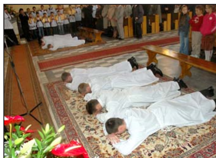
Święcenia diakonskie

W dniu 4 maja, w nowosarzyńskim kościele pod wezwaniem NMP, odbyły się po raz pierwszy w naszej parafii Święcenia Diakonatu. Diakon - jest to pierwszy stopień święceń, po którym wchodzi się w stan duchowny. Podczas