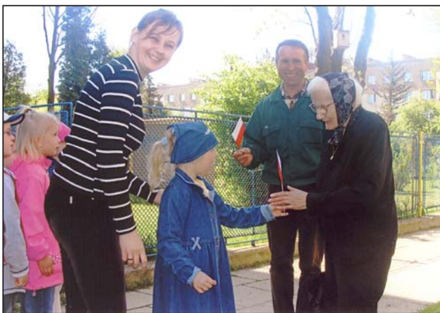
Przedszkolaki wręczały flagi przechodniom

Dla przedszkolaków była to wielka lekcja patriotyzmu, a zarazem ogromne przeżycie, które zapewne na długo pozostanie w ich pamięci. Tym bardziej, że spotkały się z wielką sympatią mieszkańców.