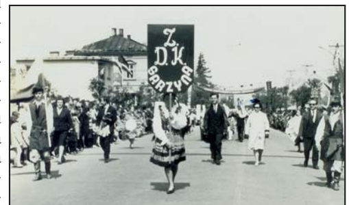
Pochód 1-go maja, Leżajsk lata 60-te

W 2005 roku oddano do użytku Miejski Ośrodek Sportu i Rekreacji /basen kryty i halę sportową/. W roku bieżącym spółka Panorama , która zapewnia mieszkańcom podstawową opiekę medyczną, po wielu latach oczekiwań, wybudowała nową przychodnię.