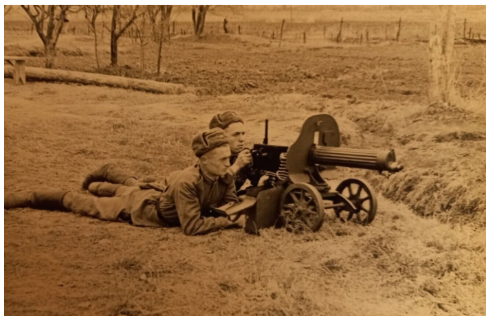
Obsada radzieckiego ckm Maxim

Po przekroczeniu Bugu oddziały radzieckie posuwały się na zachód w tempie 30 km na dobę. Niemcy wpadli w popłoch. Sztab Okręgu Wojskowego Generalnej Guberni nakazał zorganizować obronę na linii Sanu, gdzie od kilku miesięcy tysiące spędzonych tu przymusowo Polaków budowało drewniano-ziemne umocnienia i kopało rowy przeciwczołgowe. Całość miała tworzyć tzw. „San-Stellung”, czyli pozycję Sanu. Rozkazem z 20 lipca Niemcy wystali nad San wszystko, co mieli pod ręką. Do obrony przyczółków mostowych Sieniawa – Stare Miasto – Krzeszów skierowali dodatkowo połowy pułk szkolny „Nordukraine”. Oznaczało to, że rejon Leżajska i Sarzyny obsadzony był najsłabiej. Tymczasem 350 DP Armii Czerwonej pod dowództwem generała - majora G. Wiechina, błyskawicznie zmierzała w kierunku Sanu. Późnym popołudniem, 23 lipca jej oddziały rozpoznawcze