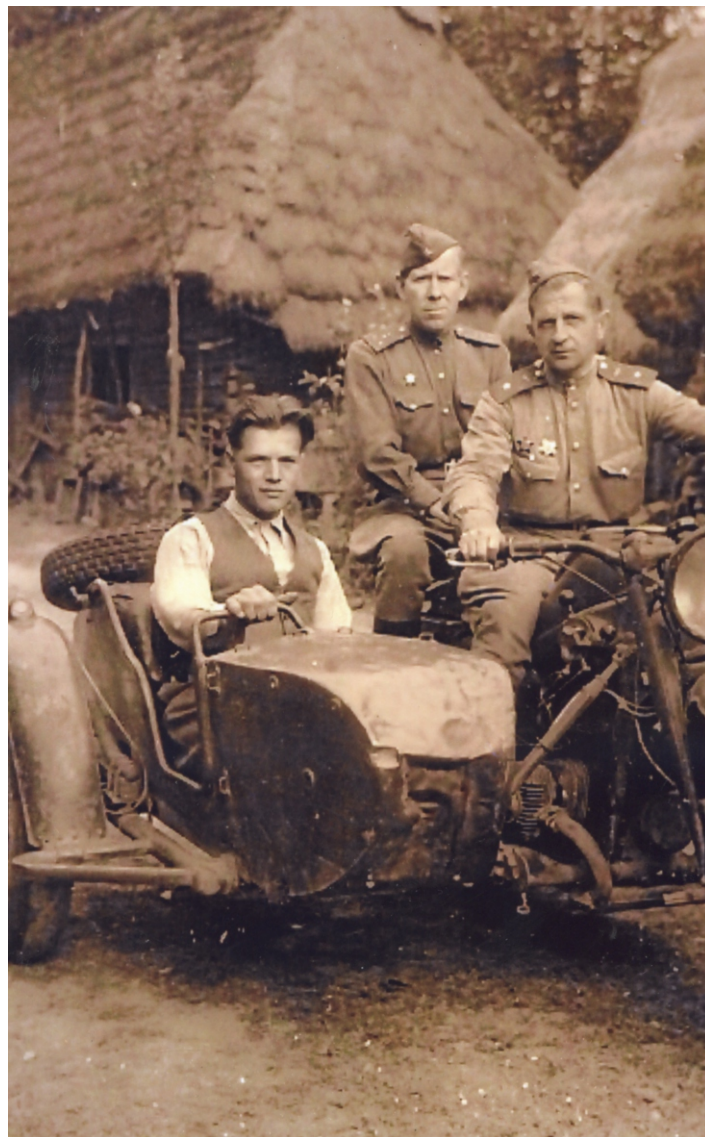
Żołnierze radzieccy w Woli Zarczyckiej