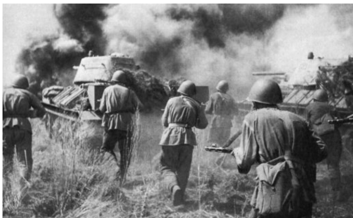
Armia Czerwona w natarciu.