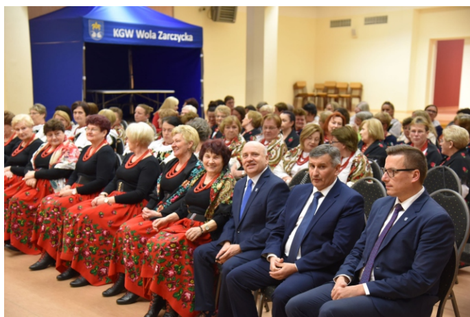
W spotkaniu uczestniczyły przedstawicielki wszystkich KGW