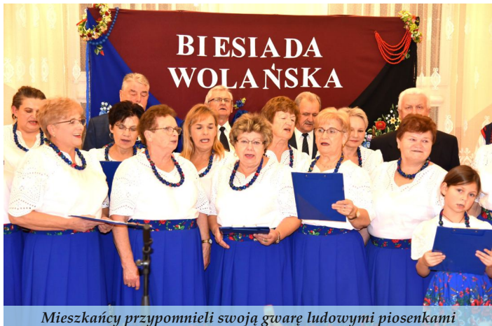
Mieszkańcy przypomnieli swoją gwara ludowymi piosenkami

Zachowanie dla przyszłych pokoleń gwary ludowej to jeden z celów przyświecających „Wolańskiej Biesiadzie”, która odbyła się 18 listopada 2023 roku. Panie z Koła Gospodyń Wiejskich w Woli Zarczyckiej przygotowały dla swoich gości prawdziwą ucztę dla ducha i ciała, pełną ludowej muzyki i przyspiewek.