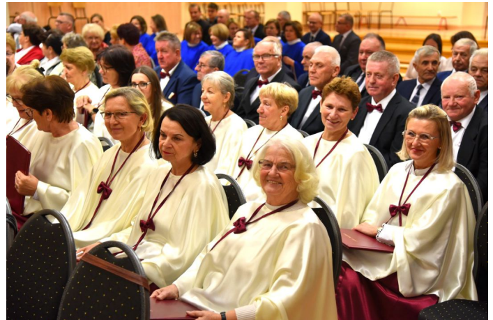
Przegląd zgromadził przeszło 100 chórzystów z sześciu parafii

22 listopada obchodziliśmy wspomnienie św. Cecylii patronki chórów i muzyki kościelnej. Z tej okazji, już po raz drugi, odbyło się spotkanie chórów parafialnych działających na terenie gminy. Tym razem śpiewających na chwałę Bogu ugościło I Liceum Ogólnokształcące w Nowej Sarzynie.