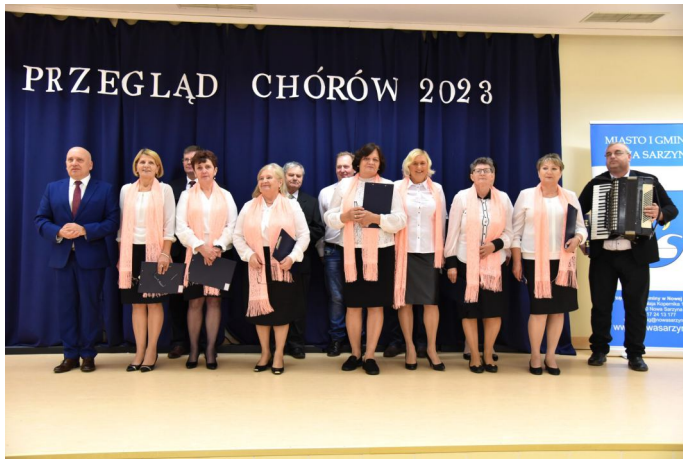
Chór parafialny działający przy parafii w Tarnogórze