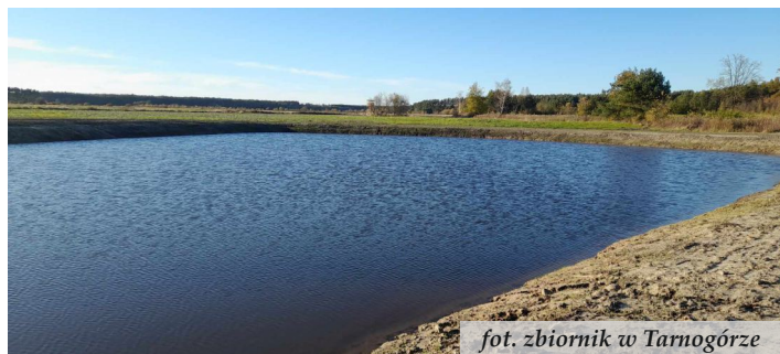
fot. zbiornik w Tarnogórze