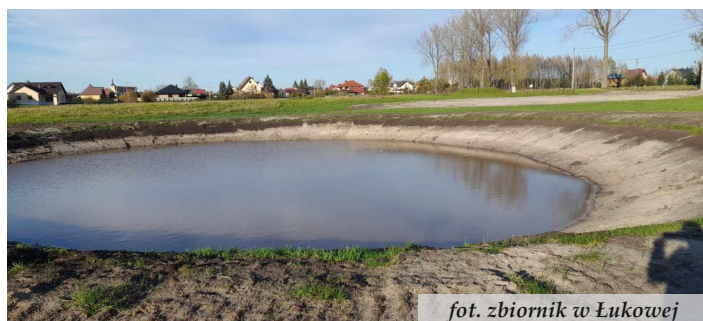
fot. zbiornik w Łukowej

Dzięki środkom pochodzącym z dotacji Województwa Podkarpackiego i budżetu Gminy Nowa Sarzyna przeprowadzono renowację dwóch zbiorników wodnych służących małej retencji w Tarnogórze i Łukowej. Zbiorniki odmulono i zabezpieczono ich skarpy.