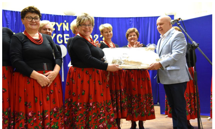
Burmistrz przekazał gospodyniom stolnicę z przyborami kuchennymi

Zanim zaproszeni mieszkańcy mogli skosztować specjalów przygotowanych przez gospodynie wiejskie, na scenie domu kultury w Sarzynie wystąpiły panie z KGW, kapela ludowa „Sarzynioki” oraz grupa wokalnie – kabaretowa „Siódemka”. Tradycyjnie zorganizowano też konkursy, zarówno dla dzieci, jak i dorosłych.