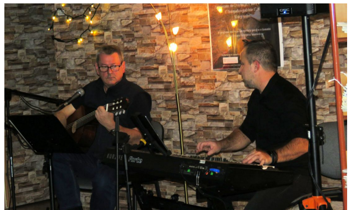
Wieczór Poezji - 10.11.2023 r.