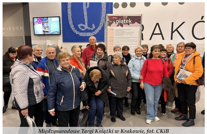
Międzynarodowe Targi Książki w Krakowie, fot. CKiB