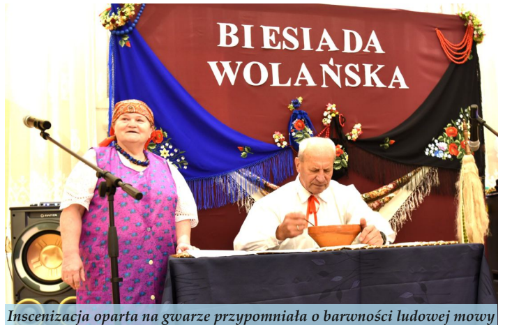
Inszenizacja oparta na gwarze przypomniła o barwności ludowej mowy

Spotkanie rozpoczęła prezentacja przez mieszkańców Woli Zarczyckiej dwóch ludowych piosenek. Po nich przyszła kolej na krótką inscenizację, w której widzowie mogli posłuchać wolańskiej gwary oraz recytowanych w niej wierszy, a następnie odbyło się wspólne biesiadowanie z muzyką ludową w tle.