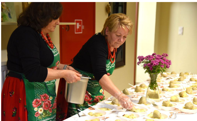
Pyszne sarzyńskie pierogi czekały na wszystkich uczestników

„Sarzyńskie Pierożycze” to jedno z wydarzeń, na które co roku mieszkańców zaprasza Koło Gospodyń Wiejskich z Sarzyny i Stowarzyszenie Ludowe „Sarzynioki”. Tegoroczna edycja odbyła się w niedzielę, 19 listopada, i jak zwykle przyciągnęła rzesze miłośników kultury ludowej i... pierogów.