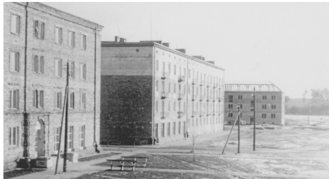
Na pierwszym planie fragment bloku nr 1 (obecnie UMiG). Za nim blok 42, w tle widok na blok nr 47 (obecnie ul. Korczaka 2) w końcowej fazie budowy. Fot. z 1958 roku.

W jesieni 1956 r. oddano do użytku największy budynek na „Starówce”: czteroklatkowy, trzypiętrowy blok nr 42 (obecnie Pl. 11 Listopada nr 1). Jego bryła odbiega od poprzednich obiektów. Jako jedyny w mieście posiada wykusze nad każdym wejściem. Do końca tegoż roku Osiedle Stałe (wraz z Kolonią) liczyły 1 500 mieszkańców. Na bazę lokalową składało się łącznie 310 mieszkań w 23 blokach i budynkach mieszkalnych. W 1957 roku ukończono blok nr 48 (teraz ul. Korczaka 4). W tymże roku Sarżyna liczyła już 1 821 mieszkańców. Do grona nowych obywateli dołączył również autor niniejszego artykułu. Ciekawostką jest, że 66 lat temu aż 240 gospodarstw - czyli ponad 77% - na terenie Osiedla i Kolonii płaciło abonament radiofoniczny.