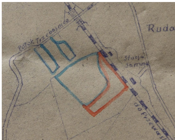
Obszar objęty wywłaszczeniami rolników oznaczony czerwoną linią. Fragment mapki z 1952 roku.

Przedmiotem sporu był areal przeznaczony do wywłaszczenia o powierzchni 36,982 m 2 . Tworzyło go łącznie 38 parcel gruntowych, a faktycznie ich części o różnej powierzchni. Poza kilkoma większymi, były to niewielkie splechety pól po kilkadziesiąt, a nawet kilka arów, których współwłaścicielami było po kilkanaście osób. Notowano i takie przypadki: wywłaszczono kawałek pola o powierzchni niepełna 12 m 2 (dwanaście metrów kwadratowych), który miał czterech współwłaścicieli z symbolicznymi udziałami po 1/7 części. Skrajnym przykładem była zaledwie 4-arowa działka, która miała aż 14 współwłaścicieli. Zofia Gnatek posiadała prawo własności 1 ara, ale kilkoro pozostałych miało mikroskopijną współwłasność po...1/192 części. Zainteresowanych nie wzywano indywidualnie, lecz zbiorowo, poprzez rozwieszenie na terenie wioski plakatów informacyjnych. Ostatecznie teren przejęto w dniu 10 kwietnia 1953 roku. W tymczasowym biurze inspektoratu nadzoru DBOR w Rudzie Łańcuckiej stawili się urzędnicy, budowlanci i 10 rolników. Nieobecni byli przedstawiciele władz powiatowych i reprezentanci władz gminy Ruda Łańcucka. Spotkanie odbyło się w napiętej atmosferze, bo jak zapisał urzędnik sporządzający dokument, wszyscy rolnicy „wydalili się przed podpisaniem protokołu”.