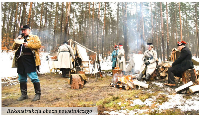
Rekonstrukcja obozu powstańczego