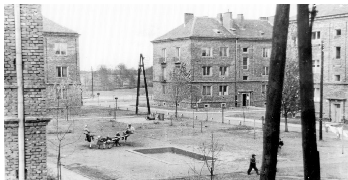
Bawiące się dzieci przed blokiem nr 7 (obecnie ul. Kopernika 2) i blokiem nr 13 (obecnie ul. 1 Maja 6). Lata 60. XX w.