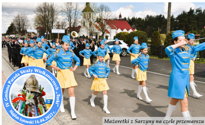
Mażoretki z Sarzyny na czele przemarszu