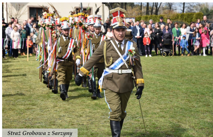
Straż Grobowa z Sarzyny