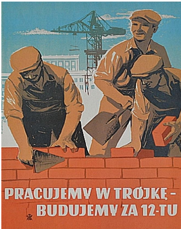
Socrealistyczny plakat propagandowy z lat 50. XX w.

siedziba biblioteki przy ul. Matejki 5) oraz blok nr 4 (obecnie ul. Sienkiewicza 1). Kompletny był dzisiaj nieistniejący biurowiec, który stał na obecnym parkingu przy ul. Matejki 1 oraz w stanie pełnym dwa bloki (obecnie oba przy ul. Jana Pawła II nr 1 i nr 3). Reszty dopełniało 5 kolejnych bloków – w stanie surowym do wykończenia: blok nr 5 (obecnie ul. Matejki 3), blok nr 6 (obecnie blok socjalny i siedziba ZGK), blok nr 7 (obecnie ul. Kopernika 2), blok nr 10 (obecnie ul. Matejki 1) oraz blok nr 13 (obecnie ul. 1 Maja 6). Po 1953 roku zajmowano kolejne tereny, od dzisiejszej ul. Mickiewicza pomiędzy linią kolejową, a ul. 1 Maja w kierunku lasu do obecnej ul. Korczaka. Do 1958 roku zbudowano w tym kwadracie ostatnie siedem murowanych bloków (obecnie ul. Parkowa nr 1 i 3, ul. Mickiewicza 1, Plac 11 Listopada 1, ul. Jordana 2 oraz ul. Korczaka nr 2 i 4).