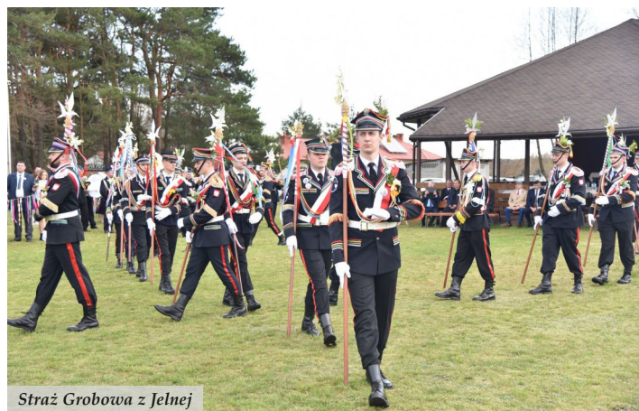
Straż Grobowa z Jelnej