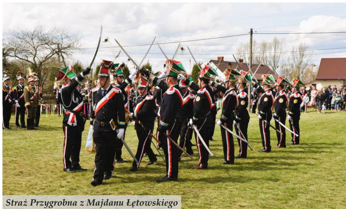
Straż Przygrobna z Majdanu Łętowskiego