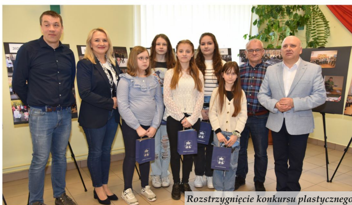
Rozstrzygnięcie konkursu plastycznego

„Upowszechnienie wiedzy na temat Powstania Styczniowego oraz jego bohaterów wśród mieszkańców Miasta i Gminy Nowa Sarzyna” to jeden z najważniejszych projektów patriotycznych w tym roku na terenie miasta i gminy Nowa Sarzyna. Przedsięwzięcie zrealizowało Stowarzyszenie Przyjaciół Tarnogóry.