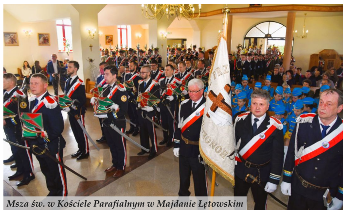
Msza św. w Kościele Parafialnym w Majdanie Łętowskim