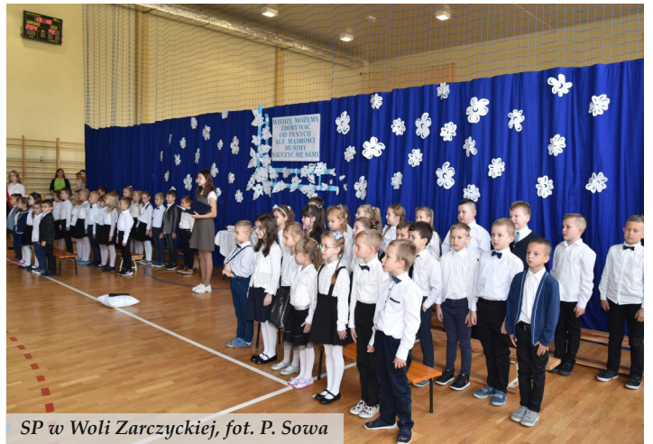
SP w Woli Zarczyckiej