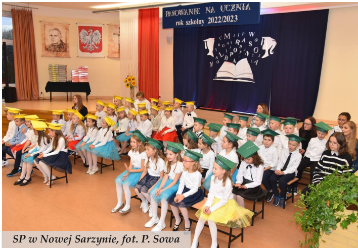
SP w Nowej Sarzynie