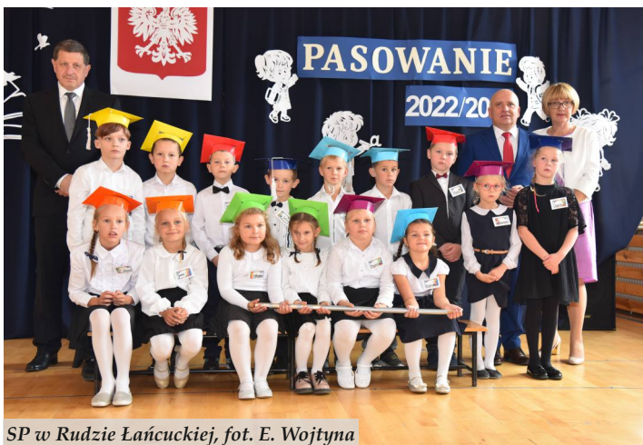
SP w Rudzie Łańcuckiej