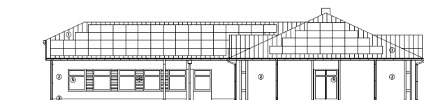
Projekt budynku Centrum Opiekuńczo-Mieszkalnego