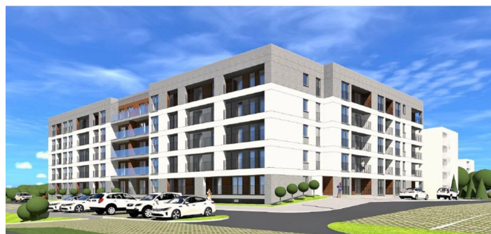
Wizualizacja budynku mieszkalnego w Nowej Sarzynie

Nasz samorząd planuje wybudować budynek z 70. mieszkaniami przy ul. Konopnickiej w Nowej Sarzynie. To propozycja przede wszystkim dla osób, które nie mają zdolności kredytowej na zakup własnego lokum, ale stać je na opłacanie czynszu i wniesienie wkładu własnego. Gmina posiada już projekt i pozwolenie na budowę, a na