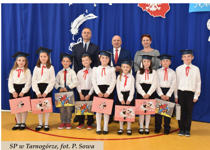
SP w Tarnogórze