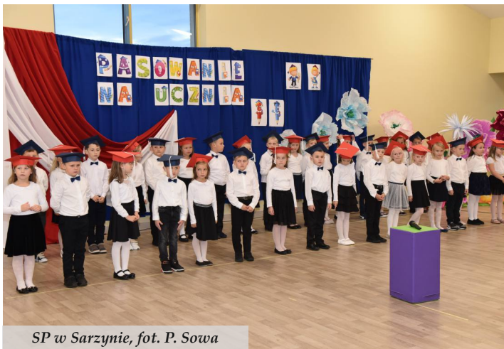
SP w Sarzynie