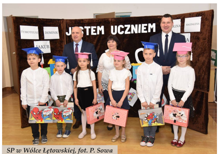
SP w Wólce Łętowskiej