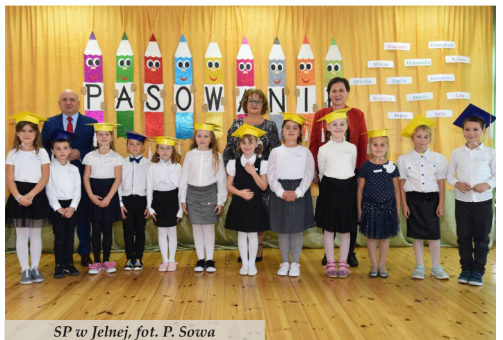
SP w Jelnej