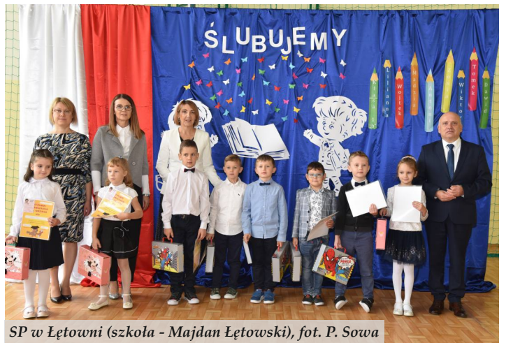
SP w Łętowni (szkoła - Majdan Łętowski)