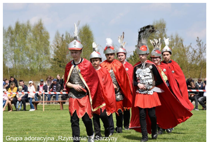
Grupa adoracyjna „Rzymianie” z Sarzyny