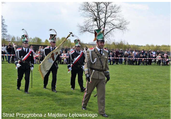
Straż Przygrobna z Majdanu Łętowskiego