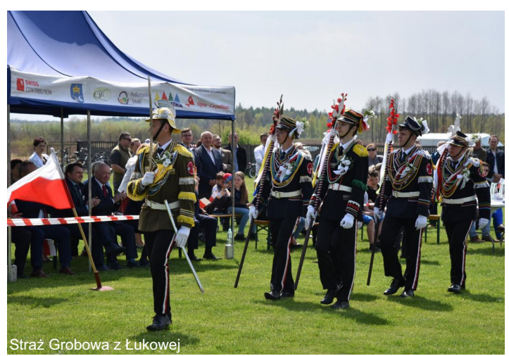
Straż Grobowa z Łukowej