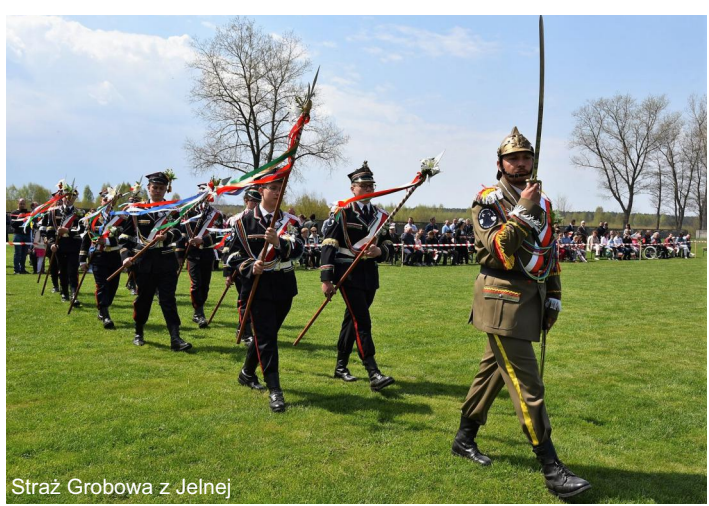
Straż Grobowa z Jelnej