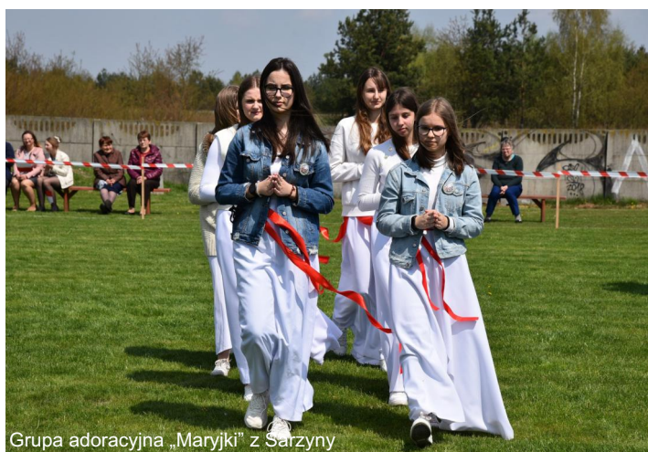
Grupa adoracyjna „Maryjki” z Sarzyny