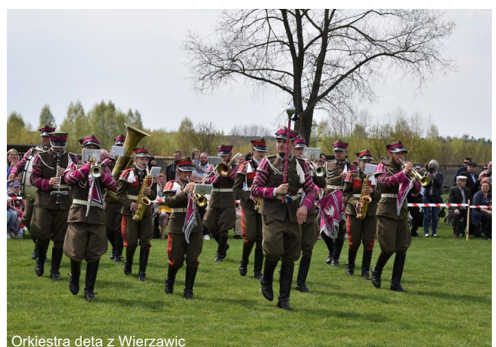
Orkiestra dęta z Wierzawic