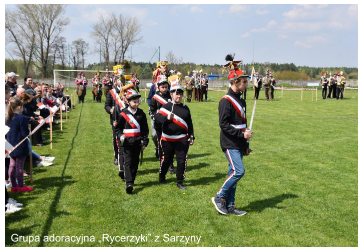
Grupa adoracyjna „Rycerzyki” z Sarzyny