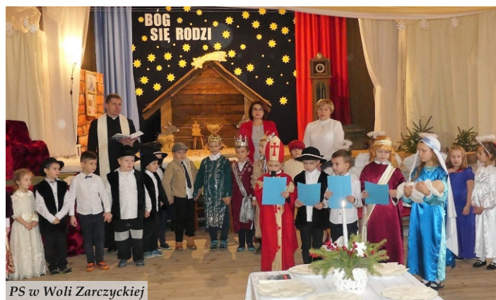
PS w Woli Zarczyckiej