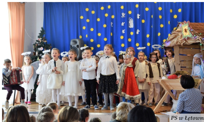
PS w Łętowni