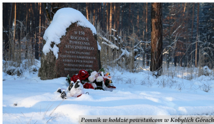
Pomnik w hołdzie powstańcom w Kobylich Górach

Odnaczenie ustanowił specjalnym „ukazem” z dnia 1 stycznia 1865 r. cesarz Aleksander II Romanow, dla nagrodzenia tych, którzy w różny sposób przyczynili się do klęski Polaków. Na awersie widnieje herb Rosji – dwugłowy czarny orzeł z carską koroną, trzymający w szponach berło i jabłko, który na piersi ma herb Księstwa Moskiewskiego – tarczę z wizerunkiem św. Jerzego walczącego ze smokiem. Na rewersie w centralnej części znajduje się data 1863–1864, a wzdłuż krawędzi wokół medalu napis - „ЗА УСМИРЕНИЕ ПОЛЬСКАГО МЯТЕЖА”. Krążek zawieszony był na pięciokątnej blaszce pokrytej wstążką w kolorach Imperium Rosyjskiego: białym, pomarańczowym i czarnym.