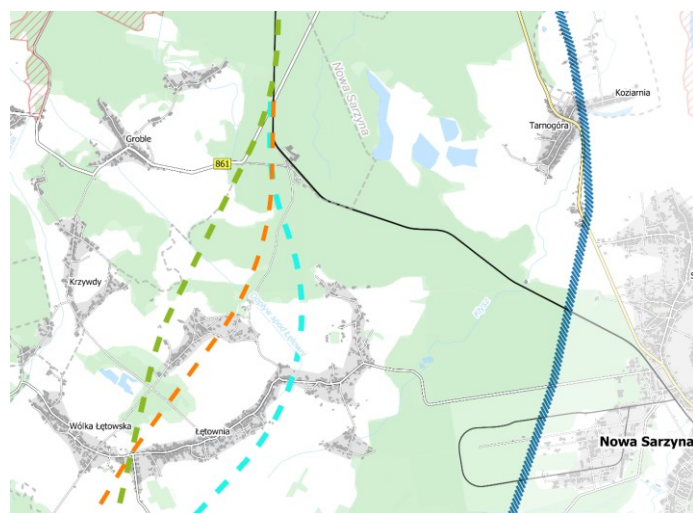
Mapa przedstawiająca warianty przebiegu planowanej linii kolejowej nr 58 na terenie gminy Nowa Sarzyna

Wśród planowanych do realizacji linii kolejowych jest także linia nr 58 Łętownia – Rzeszów. Wstępnie zawiera ona trzy warianty przebiegu. Każda z nich bierze swój początek w okolicach obecnego dworca PKP w Łętowni, łącząc się z istniejącą linią w kierunku Stalowej Woli. Następnie dwa warianty przebiegu trasy (pomarańczowy i zielony) kierują ją w okolice sołectwa Gościniec i granicy sołectw Wólka Łętowska i Łętownia, a dalej w kierunku Łowiska i Sokołowa Małopolskiego. Pomarańczowy wariant zakłada połączenie tej linii z lotniskiem w Jasionce, dlatego wydaje się być najbardziej uzasadniony do realizacji. Z kolei zielona wersja pokrywa się na terenie naszej gminy z dawną linią z Łętowni do Górna. Trzeci z wariantów – niebieski, kieruje się bardziej na wschód, między sołectwami Majdan Łętowski i Łętownia, a następnie pokrywa się na