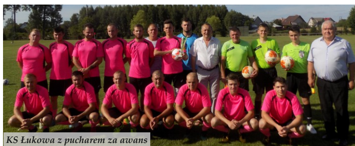
KS Łukowa z pucharem za awans

W ostatni weekend lipca ruszyły rozgrywki klasy okręgowej oraz A-klasy z udziałem drużyn z naszej gminy. Początek sezonu można uznać za udany, bo po miesiącu gry każdy z zespołów ma na swoim koncie zdobycze punktowe. Unia Nowa Sarzyna ma komplet wygranych,