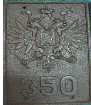
Tablica ze słupa granicznego (Rosja) zb. Muzeum w Biłgoraju.

Po stronie „galicyjskiej”, na brzegu lewym, Austriacy wkopali 11 żeliwnych słupów granicznych utrzymanych w kolorystyce czarno-żółtej, które były produkowane w odlewni w Cieszynie. Świadczy o tym napis: Teschen. Tablice z godłem państwowym nie były numerowane. Tak wyznaczona granica wraz z infrastrukturą spełniała swoje zadanie aż do wybuchu I wojny światowej w 1914 roku.