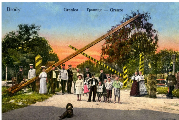
Przeście graniczne w Brodach. Poczłtówka z pocztku XX wieku.

W latach 1772-1795 w wyniku polityki mocarstwowej Rosji, Prus i Austrii oraz szeregu niekorzystnych wydarzeń wewnętrznych, w tym braku reform oraz zdrady „targowiczán”, Rzeczpospolita Obojga Narodów została na długie lata wymazana z mapy Europy. Po ostatnim rozbiórze Polski zaborcy wytyczyli i oznakowali w terenie przebieg nowych granic. Do wybuchu Wielkiej Wojny w 1914 roku, San na odcinku 11 kilometrów rozdzielał dwa mocarstwa: Austrię i Rosję. Granica biegła środkiem rzeki od komory celnej w Kamionce do ujścia Złotej koło Kulna. Na prawym, „rosyjskim” brzegu rzeki znaki graniczne miały numerację od 253 do 264. Żeliwne tablice z godłem Rosji były umieszczane na drewnianych słupach malowanych w czarno-białe-czerwone barwy.