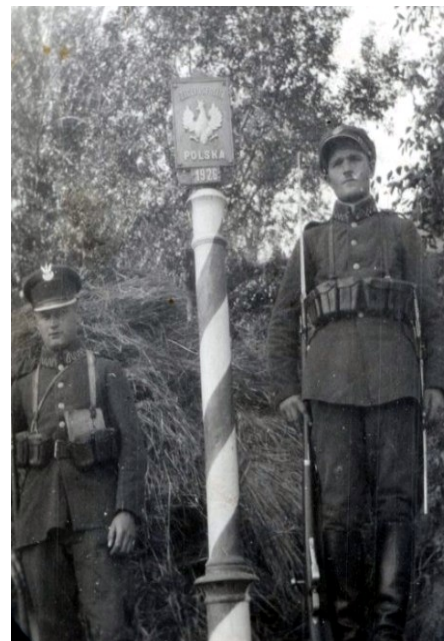
Poaustrackie słupy graniczne „w służbie” II RP.

czyli stopu cynku i aluminium, w renomowanej Fabryce Guzików i Wyrobów Metalowych L. Munchheimera w Warszawie.