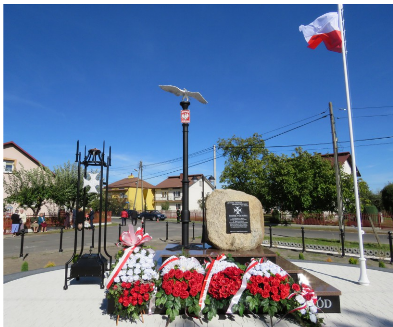
Pomnik Wolności w Sarzynie.

Pomnik został wzniesiony jako wotum dziękczynne złożone Bogu za dar wolności i w podziękowanie polskim bohaterom, którzy walczyli o wyzwolenie spod jarzma zaborców w powstaniach narodowych i na różnych frontach Europy. Głównym elementem pomnika jest oryginalny austriacki słup graniczny. Orzeł z rozpostartymi skrzydłami umieszczony na jego szczycie symbolizuje zwycięstwo nad zaborcami. Poniżej przytwierdzona jest polska tablica graniczna z godłem z 1919 roku. Na głazie widnieje Krzyż Virtuti Militari, pod nim okolicznościowa inskrypcja. Na podstawie cokołu wyryto fragment Roty „Nie