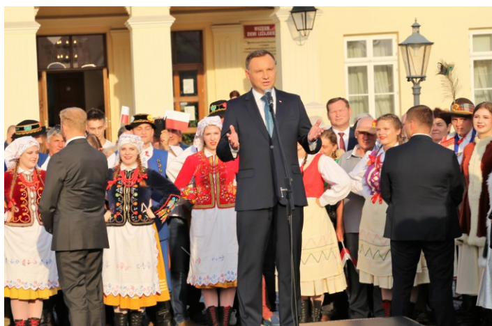
Prezydent w trakcie wizyty w Leżajsku w 2018 roku

W niedzielę 12 lipca 2020 r. odbyła się II tura wyborów Prezydenta Rzeczypospolitej Polskiej. Na ponowną, pięcioletnią kadencję został wybrany Andrzej Duda, który uzyskał 51,03% poparcia, a Rafał Trzaskowski 48,97%. Frekwencja wyniosła 68,18%.