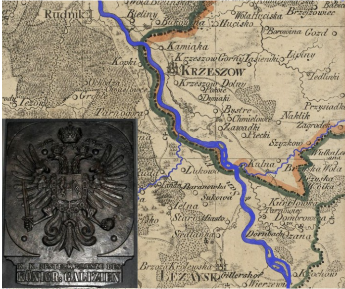
Przebieg granicy na Sanie na mapie z 1824 roku. Tablica z austriackiego słupa granicznego (Austro-Węgry) zbiory Muzeum w Zamościu.

Geodezyjne słupy i słupki graniczne towarzyszą nam w życiu powszechnie. Wyznaczają obszary działek, pól czy lasów. Ale wędrując po nadszańskich polach i łąkach, przy odrobinie szczęścia, możemy natrafić na tajemnicze, żeliwne słupki z liczbami i literami. W obiegowej opinii są to znaki po dawnej granicy pomiędzy tzw. Galicją a „Kongresówką”. Faktycznie są to repery, czyli słupki geodezyjne do wyznaczania długości rzeki. Słupów po dawnej granicy z Rosją zachowało się w Polsce niewiele i są dziś dużą historyczną ciekawostką. Jedna z takich atrakcji stoi w centrum wsi Sarżyna.