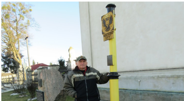
Pomnik Niepodległości w Zaklikowie, fot. ze zb. Janusza Motyki.

Żeliwne tablice wyznaczające granice Austro-Węgier i Rosji zachowały się m.in. w muzeach w Zamościu, Lubartowie i wymienionym już Biłgoraju. Trzeba też wiedzieć, że część tablic granicznych znajduje się w rękach kolekcjonerów.