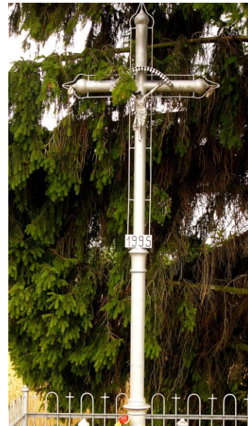
Krzyże przydrożne zbudowane na bazie austro-węgierskich słupów granicznych: w Przyhojcu (po lewej) i w Prehoryle (po prawej).

zrucim ziemi skąd nasz ród". Obok leżą połamane żeliwne tablice graniczne Rosji i Austro-Węgier jako symbol upadku wrogów. Ustawiono też maszt flagowy oraz znicz oparty na symbolicznych karabinach z nasadzonymi bagnetami. W podstawie znicza znajduje się urna wypełniona ziemią z 32 pól bitew, w których brali udział Polacy. Idea pomnika zakłada, że lista pozostaje otwarta. Kolejne pojemniki z ziemią są uroczystie składane w urnie. Osoby, bądź organizacje, które dostarczyły ziemię, wpisywane są w specjalnym wykazie prowadzonym w Szkole Podstawowej im. ks. Stefana Kardynała Wyszyńskiego w Sarzynie.