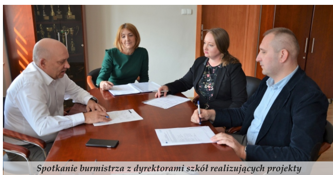
Spotkanie burmistrza z dyrektorami szkół realizujących projekty

Od 1 września 2020 r. do 31 sierpnia 2021 r. Szkoła Podstawowa w Sarzynie będzie realizować projekt ponadnarodowej mobilności uczniów, sfinansowany ze środków Programu Operacyjnego Wiedza Edukacja Rozwój . Projekt polega na organizacji wyjazdów uczniów do szkoły partnerskiej w Rumunii. W wyjazdach uczestniczyć będzie 30 uczniów i 6 opiekunów, a koszt zadania wyniesie 147 428 zł.