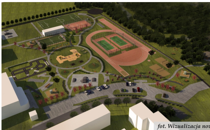
fot. Wizualizacja nowego obiektu sportowego