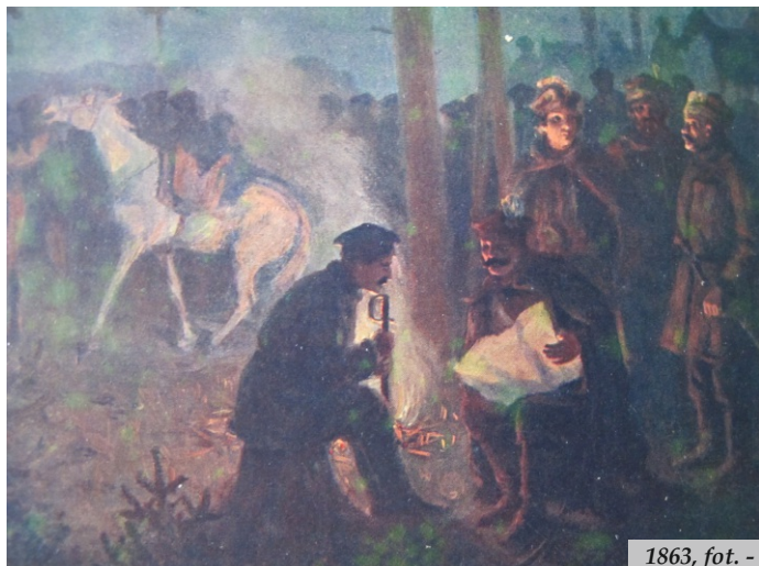
1863, fot. - zbiory autora