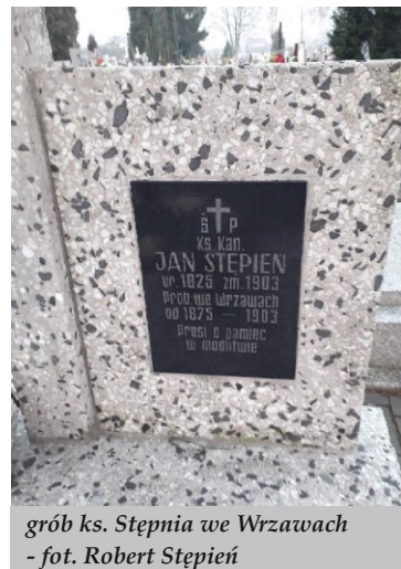
grób ks. Stępnia we Wrzawach