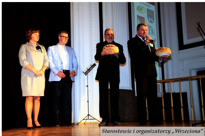
Starostowie i organizatorzy „Wrzeciona”