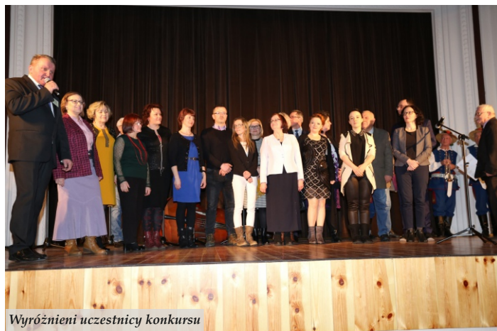
Wyróżnieni uczestnicy konkursu