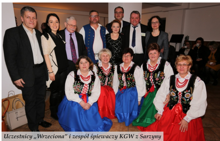
Uczestnicy „Wrzeciona” i zespół śpiewaczy KGW z Sarzyny