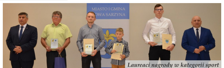
Laureaci nagrody w kategorii sport