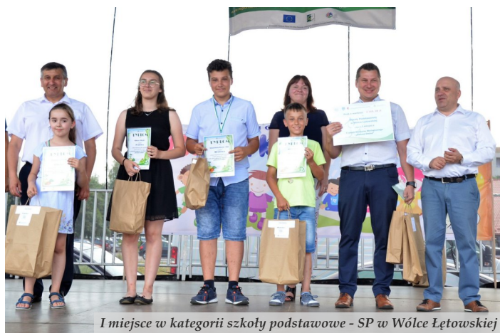
I miejsce w kategorii szkoły podstawowe - SP w Wólce Łętowskiej