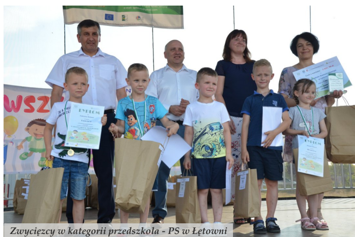
Zwycięzcy w kategorii przedszkola - PS w Łętowni