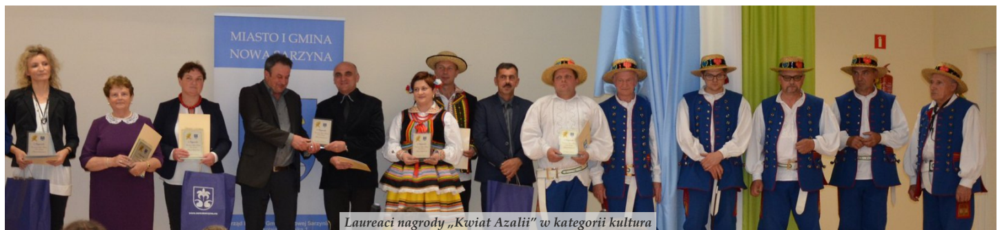
Laureaci nagrody „Kwiat Azalii” w kategorii kultura