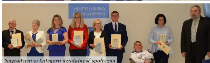
Nagrodzeni w kategorii działalność społeczna