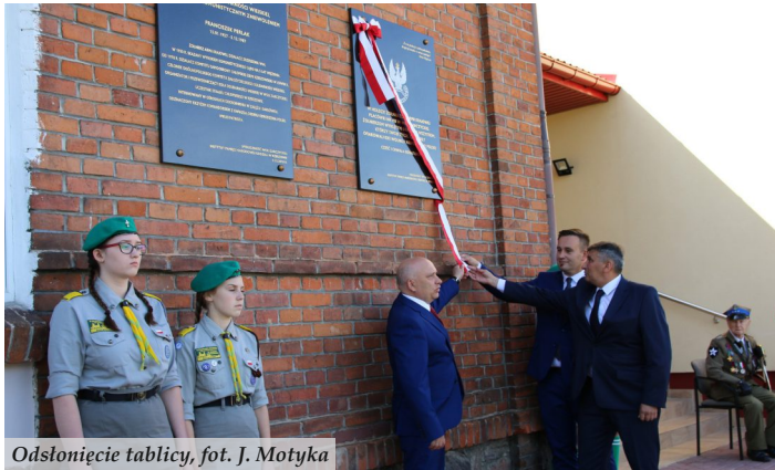
Odsłonięcie tablicy