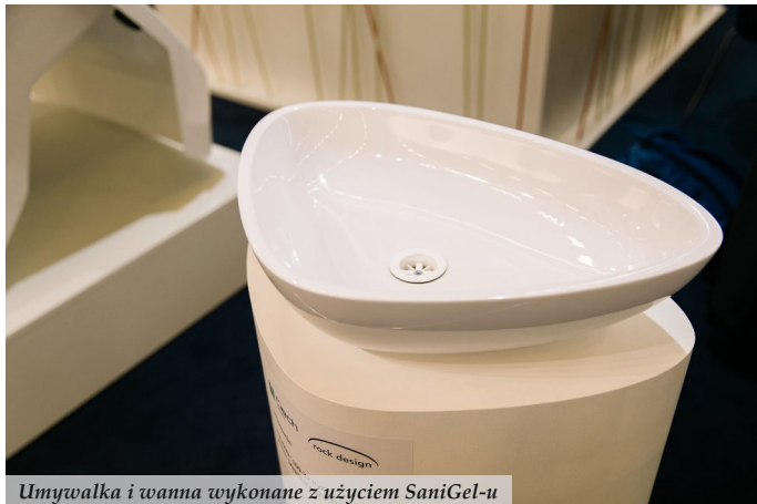
Umywalka i wanna wykonane z użyciem SaniGel-u