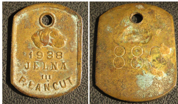
Psia marka z Jelnej

Czipy, metalowe bądź plastikowe znaczkę dla zwierząt to dzisiaj europejski standard. System znakowania psów metalowymi markami znany jest od wieków. Ich produkcją zajmowali się, zarówno wiejscy kowale, jak też renomowani rzemieślnicy i metaloplastycy. Współcześnie, te nierzadko wyjątkowej urody drobiazgi, są przedmiotami poszukiwanymi przez kolekcjonerów i ozdobami ich zbiorów. Jak choćby „psie marki” z Sarzyny, Woli Zarczyckiej, Łętowni czy Jelnej.