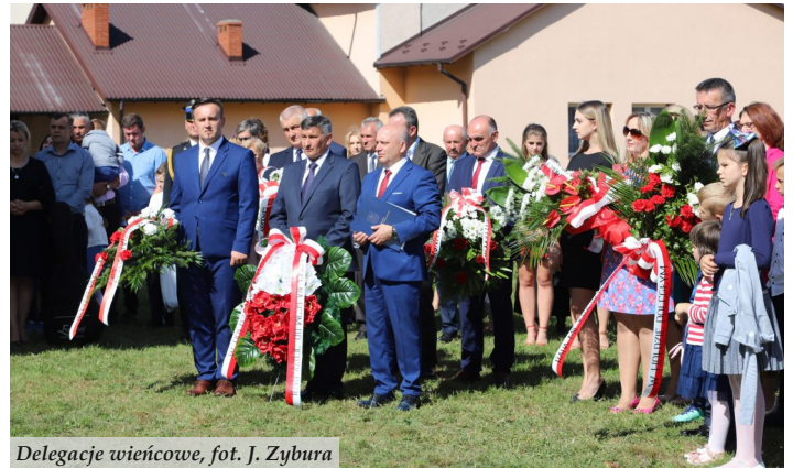
Delegacje wieńcowe

Kolejnym ważnym dla społeczności Woli Zarczyckiej wydarzeniem w tym dniu, było otwarcie Izby Pamięci w Szkole Podstawowej, w sali,