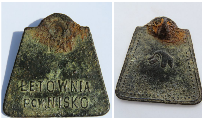
Psia marka z Łętowni (zb. Muzeum Ziemi Leżajskiej)