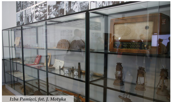
Izba Pamięci

w której 76. lat temu odbył się sąd nad mieszkańcami w trakcie pacyfikacji wsi. W wyremontowanym i urządzonej na wzór sal muzealnych pomieszczeniu znalazły się cenne eksponaty. Tematem przewodnim izby jest pacyfikacja, stąd znalazła się wystawa fotografii z ubiegłorocznej rekonstrukcji historycznej, dokumenty oraz militaria, m.in. umundurowanie, broń, naboje, hełmy, odznaczenia państwowe. W ekspozycji znalazły się także dawne sprzęty domowe, związane z życiem codziennym mieszkańców, jak lampy, radia i żelazka.