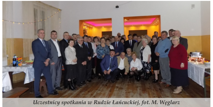
Uczestnicy spotkania w Rudzie Łańcuckiej