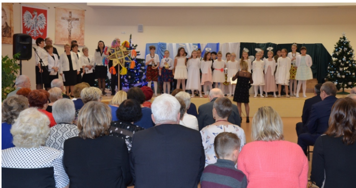
Wspólny występ seniorów i dzieci w trakcie spotkania w N. Sarzynie