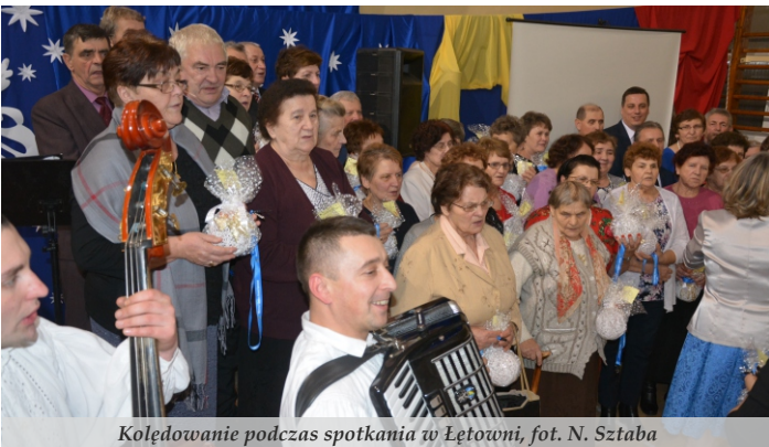
Kolędowanie podczas spotkania w Łętowni