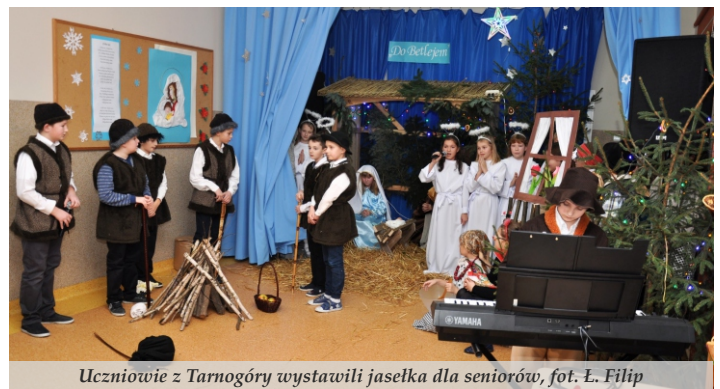
Uczniowie z Tarnogóry wystawili jasełka dla seniorów