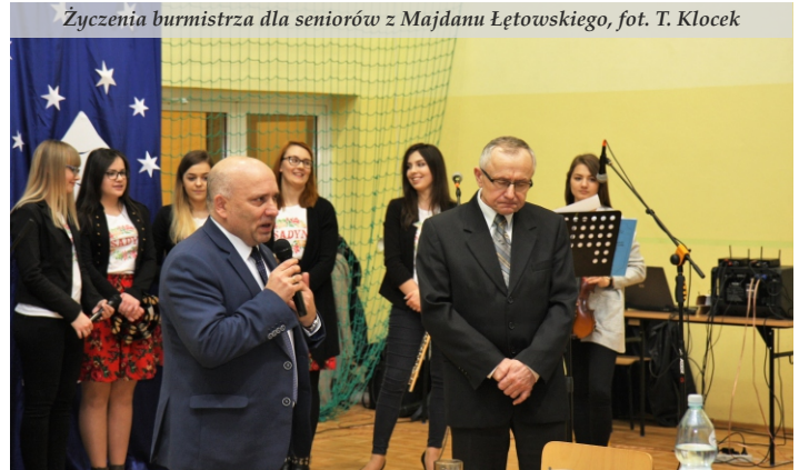
Życzenia burmistrza dla seniorów z Majdanu Łętowskiego