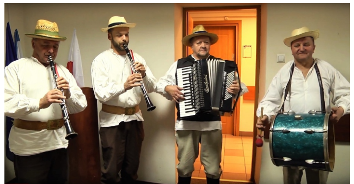
Na LVII sesję z kolędą przybyła kapela ludowa „Majdaniarze” z Nowej Sarzyny.

Planowane dochody budżetu gminy zwiększono o kwotę 196 tys. zł. Środki te pochodzą ze powiększenia subwencji oświatowej oraz refundacji wydatków z dotacji celowych w ramach programów finansowanych z udziałem środków europejskich. Dokonano również zmian w planie wydatków na łączną kwotę 92 tysięcy złotych.