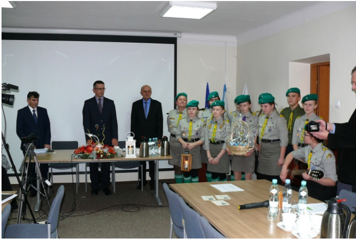
Na LVI sesji gościli członkowie 8. Drużyny Harcerskiej „Kameleon” w Nowej Sarzynie, którzy przekazali samorządowcom Betlejemskie Światło Pokoju.