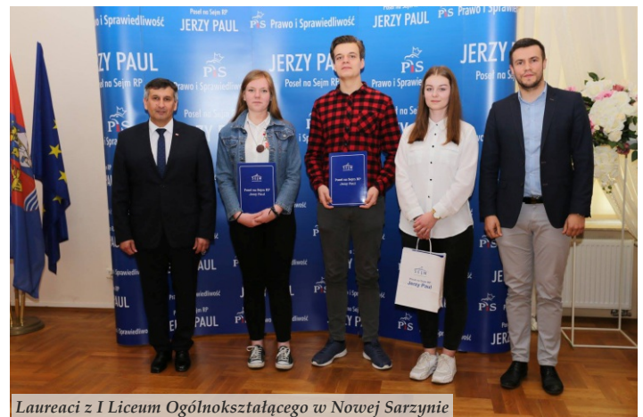
Laureaci z I Liceum Ogólnokształcącego w Nowej Sarzynie

Konkurs cieszył się dużym zainteresowaniem, zarówno ze strony ww. szkół, jak i uczniów, którzy wykazali się dużą wiedzą na temat