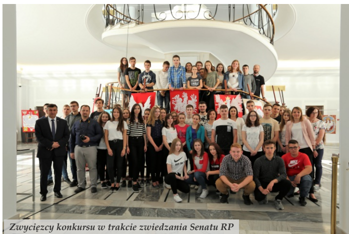
Zwycięzcy konkursu w trakcie zwiedzania Senatu RP