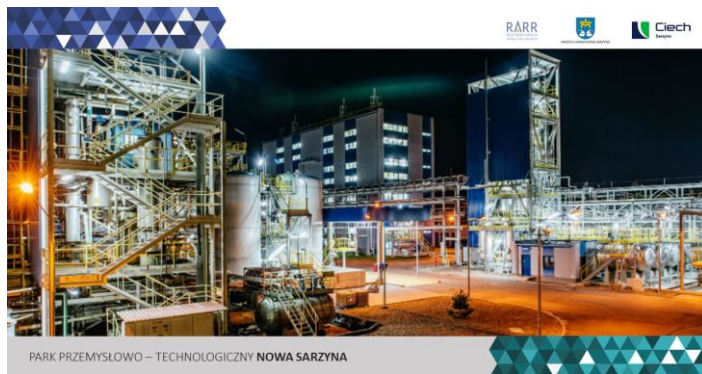
PARK PRZEMYSŁOWO – TECHNOLOGICZNY NOWA SARZYNA