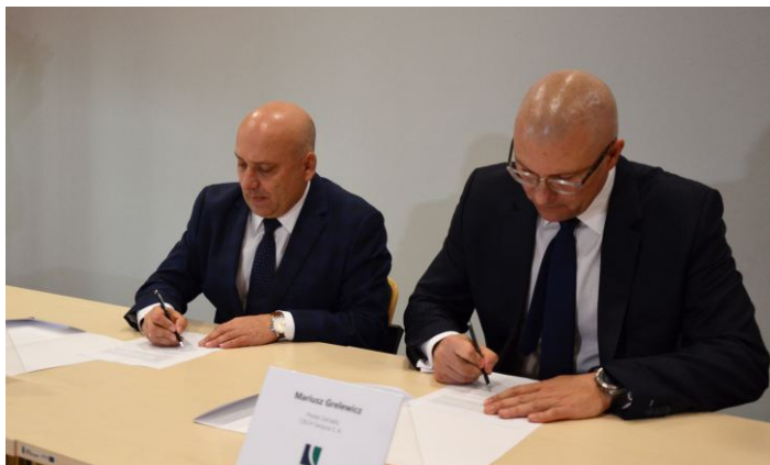
podpisanie listu intencyjnego

W Nowej Sarzynie powstanie „Park Przemysłowo-Technologiczny Nowa Sarzyna”. To miejsce doskonale przystosowane do prowadzenia działalności przemysłowej, z dostępem do niezbędnej infrastruktury technicznej (m.in. pary, gazu, prądu, wody i kanalizacji przemysłowej) oraz dogodnej infrastruktury drogowej i kolejowej. Miasto Nowa Sarzyna posiada tradycje przemysłowe sięgające lat 30-tych XX wieku, a na jego terenie działają m.in. jedne z największych zakładów chemicznych w Polsce – CIECH Sarzyna „Park Przemysłowo-Technologiczny Nowa Sarzyna” jest już przygotowany do przyjmowania nowych inwestorów, oferując działki o powierzchni od 1 do nawet 60 ha.