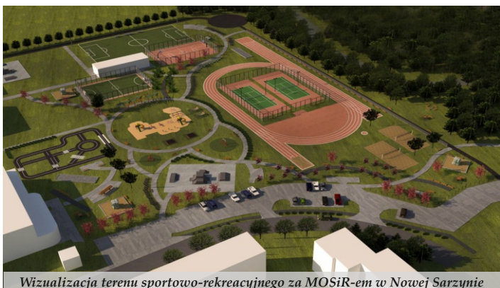
Wizualizacja terenu sportowo-rekreacyjnego za MOSiR-em w Nowej Sarzynie

● Zakończono przebudowę drogi powiatowej NR 1084R na odcinku leśnym z Nowej Sarzyny do Majdanu Łętowskiego, gdzie powstała także ścieżka rowerowa oraz na odcinku w Wólce Łętowskiej wraz z chodnikiem dla pieszych. Zadanie o wartości 7,4 mln zł zostało realizowane wspólnie z Powiatem Leżajskim przy dofinansowaniu z RPO WP na lata 2014-2020 w wysokości 6,3 mln zł. Za kwotę 3,5 mln zł wyremontowano drogę gminną o długości 4,3 km z Łętowni do stacji kolejowej w tej miejscowości wraz z budową ronda. W Sarzynie za blisko 2,2 mln zł przebudowano nawierzchnię głównej drogi biegnącej przez sołectwo, odcinek w centrum pomiędzy mostem a kościołem oraz drogę na działkach o nr 3343/1 i 33343/2. W Jelnej wykonano nowe nawierzchnie asfaltowe na drogach gminnych o nr 104825R, 2281 i 1004828R, 104827R i 1810 za łączną kwotę 1,1 mln zł. W Woli Zarczyckiej przebudowano drogi gminne nr 104726R i 104751R za niespełna 700 tys. zł. Wyremontowano także odcinki dróg gminnych w Łukowej, Judaszówce, Gościńcu, Rudzie Łańcuckiej i Łętowni o wartości 500 tys. zł.