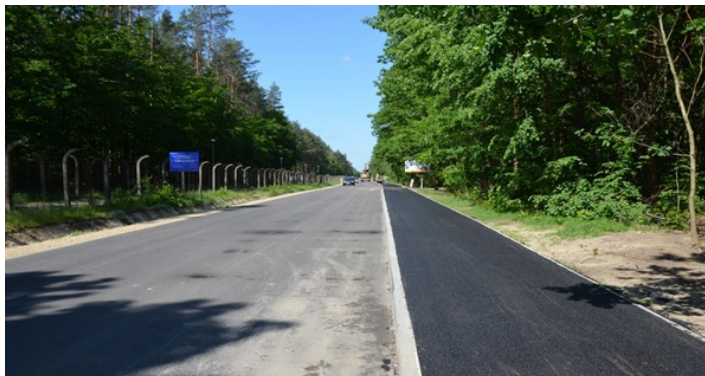
Droga powiatowa i ścieżka rowerowa z Nowej Sarzyny do Majdanu Łętowskiego

● Ponad 130 zadań i projektów inwestycyjnych zostało zrealizowanych w tym roku na terenie Miasta i Gminy Nowa Sarzyna. Najwięcej środków wydatkowano na infrastrukturę drogową i oświatową.