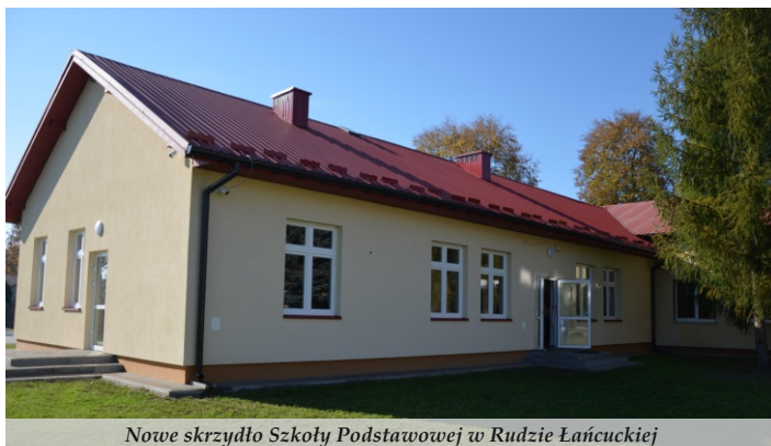
Nowe skrzydło Szkoły Podstawowej w Rudzie Łańcuckiej

● W Łętowni, Rudzie Łańcuckiej, Sarzynie, Woli Zarczyckiej oraz na Osiedlu Nr 3 w Nowej Sarzynie powstały otwarte strefy aktywności, na których zamontowano obiekty i urządzenia do siłowni plenerowej, strefy relaksu i placu zabaw o charakterze sprawnościowym. Na zadanie przeznaczono 569 tys. zł. Opracowano dokumentację na budowę systemu nawodnienia boisk sportowych w Nowej Sarzynie, Jelnej i Łukowej. Na stadionie w Jelnej wyremontowano część trybun i zamontowano bramę wjazdową. Na stadionie w Sarzynie została zamontowana trybuna dla widzów.