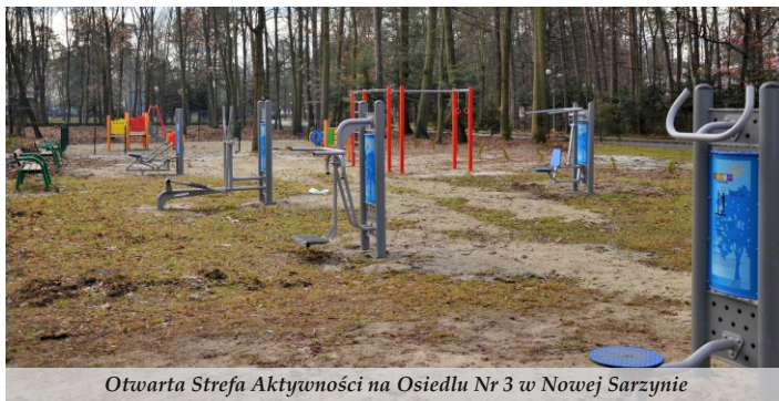
Otwarta Strefa Aktywności na Osiedlu Nr 3 w Nowej Sarzynie

● W Łętowni przy drodze w kierunku Woli Zarczyckiej powstał chodnik o długości 480 metrów wraz z kolektorem ściekowym. W Nowej Sarzynie przy ul. Profesora Tołpy, Konopnickiej, 1 Maja i Azalii Pontyjskiej wybudowano nowe miejsca parkingowe oraz utwardzono drogi dojazdowe do garaży na Osiedlu Janda za łączną kwotę 372 tys. zł. Opracowano także dokumentację związaną z projektem Rewitalizacji Gminy Nowa Sarzyna, który zakłada budowę chodników, ścieżek pieszo-rowerowych na terenie miasta oraz złożono wnioski o dofinansowanie zadania pn. „Zagospodarowanie terenu za budynkiem MOSiR”, w ramach którego planuje się utworzyć nowoczesny teren rekreacyjno-sportowy. Na Osiedlu Janda powstała plaża miejska wraz z boiskami do siatkówki plażowej i piłki nożnej, a w Sarzynie przystań kajakowa przy Trzebośnicy.