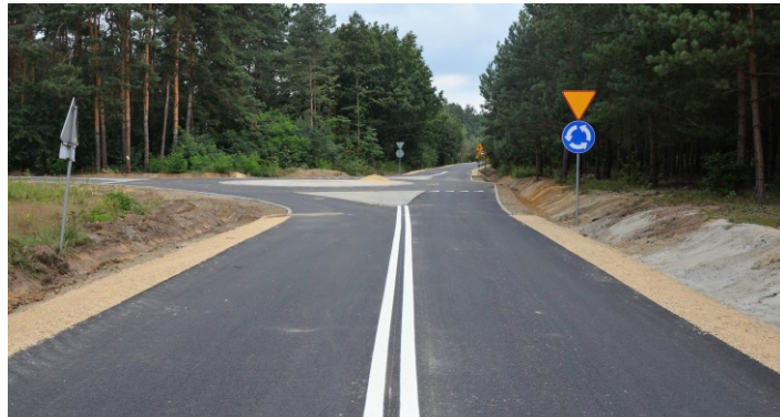
Rondo na drodze gminnej w kierunku stacji PKP w Łętowni

● W Łętowni przy drodze w kierunku Woli Zarczyckiej powstał chodnik o długości 480 metrów wraz z kolektorem ściekowym. W Nowej Sarzynie przy ul. Profesora Tołpy, Konopnickiej, 1 Maja i Azalii Pontyjskiej wybudowano nowe miejsca parkingowe oraz utwardzono drogi dojazdowe do garaży na Osiedlu Janda za łączną kwotę 372 tys. zł. Opracowano także dokumentację związaną z projektem Rewitalizacji Gminy Nowa Sarzyna, który zakłada budowę chodników, ścieżek pieszo-rowerowych na terenie miasta oraz złożono wnioski o dofinansowanie zadania pn. „Zagospodarowanie terenu za budynkiem MOSiR”, w ramach którego planuje się utworzyć nowoczesny teren rekreacyjno-sportowy. Na Osiedlu Janda powstała plaża miejska wraz z boiskami do siatkówki plażowej i piłki nożnej, a w Sarzynie przystań kajakowa przy Trzebośnicy.