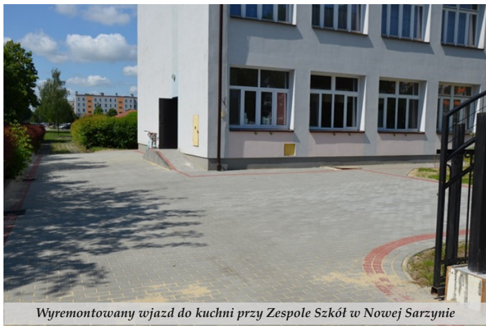
Wyremontowany wjazd do kuchni przy Zespole Szkół w Nowej Sarzynie

● W pierwszym kwartale bieżącego roku zakończono dwie największe inwestycje oświatowe w kadencji 2014-2018: rozbudowę szkoły w Sarzynie o budynek oddziału przedszkolnego za blisko 2,9 mln zł oraz budowę sali gimnastycznej przy Szkole Podstawowej w Woli Zarczyckiej o wartości 1,6 mln zł. W październiku oddano do użytku nowo wybudowane skrzydło Szkoły Podstawowej w Rudzie Łańcuckiej za kwotę 723 tys. zł. Wyremontowano także: pokrycia dachowe budynku szkolnego w Tarnogórze i Przedszkola Samorządowego w Woli Zarczyckiej, taras budynku Przedszkola Samorządowego „Jedyneczka”, budynek gospodarczy przy szkole w Wólce Łętowskiej, wjazd do kuchni przy ZS w Nowej Sarzynie oraz ogrodzenie terenu SP w Łętowni. Wykonano również dokumentację projektową na budowę budynku przedszkolnego w Woli Zarczyckiej i sali gimnastycznej w Tarnogórze.