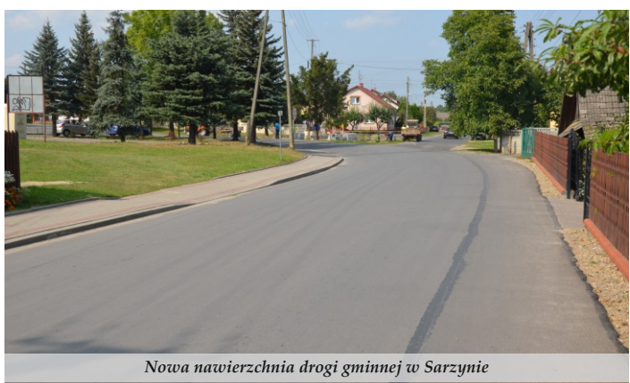
Nowa nawierzchnia drogi gminnej w Sarzynie

● Ponad 130 zadań i projektów inwestycyjnych zostało zrealizowanych w tym roku na terenie Miasta i Gminy Nowa Sarzyna. Najwięcej środków wydatkowano na infrastrukturę drogową i oświatową.