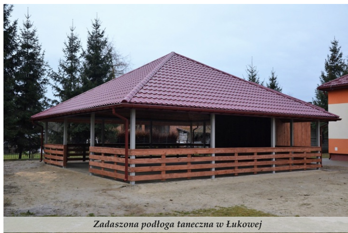
Zadaszona podłoga taneczna w Łukowej

● W zakresie infrastruktury kulturalnej powstała zadaszona scena plenerowa w Łukowej za kwotę blisko 100 tys. zł, zagospodarowano teren przy Pomniku Ofiar Pacyfikacji w Woli Zarczyckiej za ponad 125 tys. zł oraz opracowano dokumentację projektową przebudowy