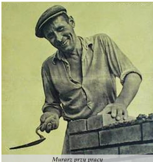
Murarz przy pracy