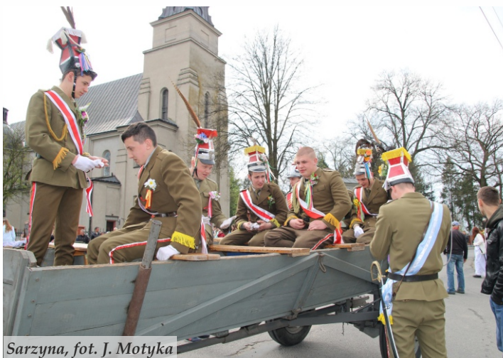
Sarzyna, fot. J. Motyka