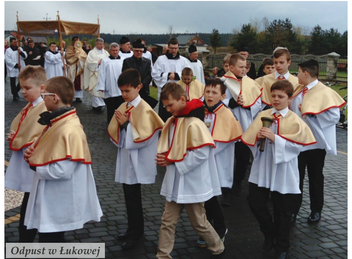
Odpust w Łukowej

Więcej zdjęć w fotogalerii na ostatniej stronie.