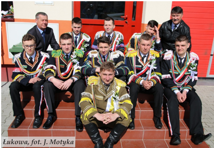
Łukowa, fot. J. Motyka