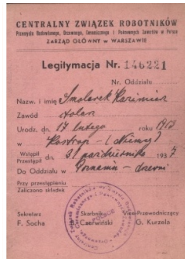
Legitymacja CZRPBDCiPZ z 1937 r.

Autor zachęca Czytelników do dzielenia się informacjami na powyższy temat. Kontakt przez redakcję.