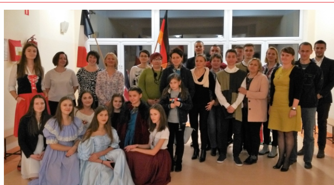
27 października w I Liceum Ogólnokształcącym w Nowej Sarzynie odbył się Dzień Języków Obcych, w którym brali udział również rodzice. Uczniowie przygotowali tematyczne prezentacje i wspólnie z rodzicami rywalizowali w konkursie „Czyja to flaga”.