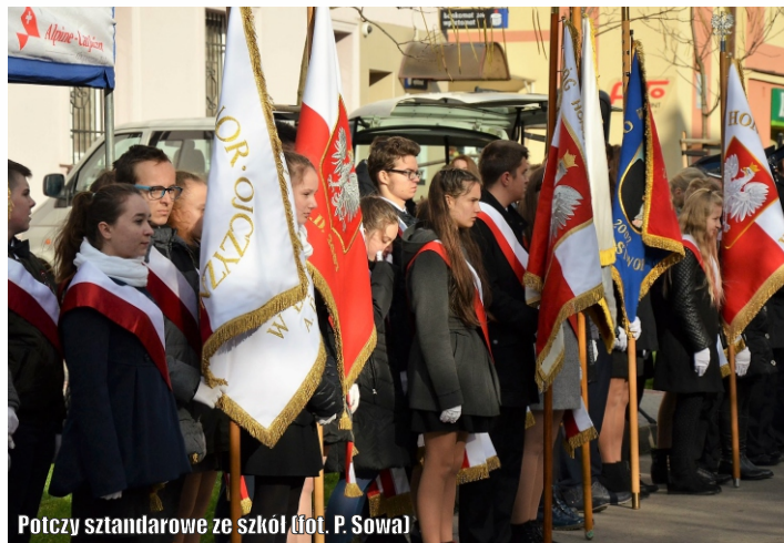
Potczy sztandarowe ze szkół