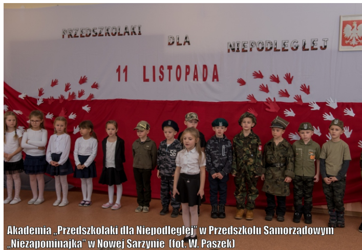
Akademia „Przedszkolaki dla Niepodległych” w Przedszkolu Samorządowym „Niezapominajka” w Nowej Sarzynie