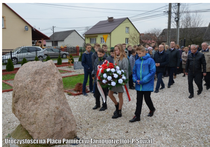
Uroczystości na Placu Pamięci w Tarnogórze