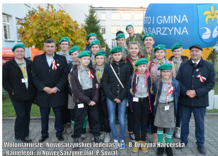
Wolontariusze „Nowosarzynskiej Jedenastki” - 8. Drużyna Harcerska „Kameleon” w Nowej Sarzynie