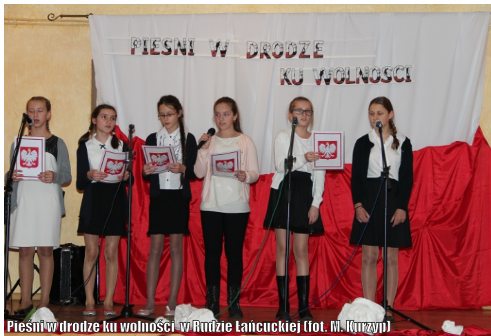
Pieśni w drodze ku wolności w Rudzie Łańcuckiej