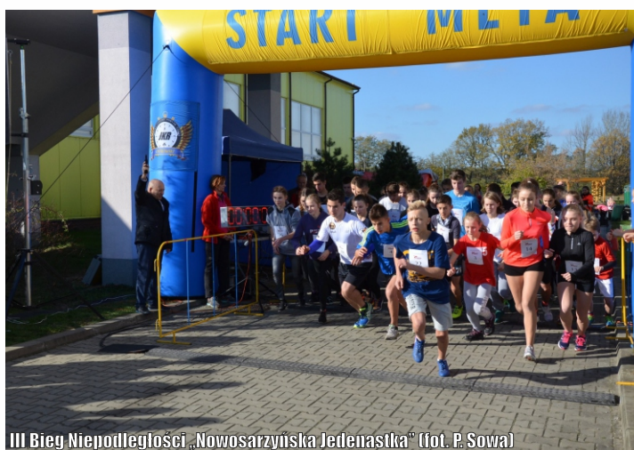
III Bieg Niepodległości „Nowosarzynska Jedenastka”