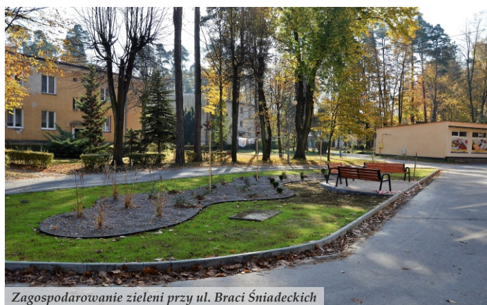
Zagospodarowanie zieleni przy ul. Braci Śniadeckich