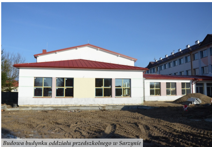
Budowa budynku oddziału przedszkolnego w Sarzynie

przy szkole w Woli Zarczyckiej, która będzie kosztować 1,6 mln zł. Oba zadania uzyskały dofinansowanie z RPO WP na lata 2014-2020 w kwotach 973 tys. i 761 tys. zł. W trakcie realizacji jest także rozbudowa Szkoły Podstawowej w Rudzie Łańcuckiej, której wartość wyniesie 594 tys. zł. Wymieniono również ogrodzenie w tej placówce za kwotę 29 tys. zł. Przebudowano także ogrodzenia Szkoły Podstawowej w Nowej Sarzynie za kwotę 30 tys. zł oraz SP w Wólce Łętowskiej wraz z remontem budynku gospodarczego o wartości 81 tys. zł. W Tarnogórze wyremontowano dach budynku szkolnego za kwotę 56 tys. zł oraz zlecono opracowanie dokumentacji projektowej budowy sali gimnastycznej w tej placówce. Pozostałe remonty i zakupy wyposażenia w jednostkach oświatowych kosztowały ponad 200 tys. zł.