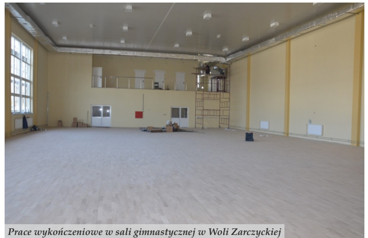
Prace wykończeniowe w sali gimnastycznej w Woli Zarczyckiej

● Na inwestycje w infrastrukturę oświatową wydatkowano 5,5 mln zł. Obecnie trwa rozbudowa szkoły w Sarzynie o budynek oddziału przedszkolnego za blisko 2,9 mln zł oraz budowa sali gimnastycznej