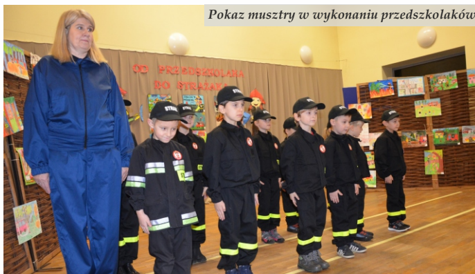
Pokaz musztry w wykonaniu przedszkolaków

Projekt współfinansowany ze środków programu „Działaj Lokalnie X” Polsko-Amerykańskiej Fundacji Wolności, realizowanego we współpracy z Akademią Rozwoju Filantropii w Polsce oraz Fundacją Fundusz Lokalny w Leżajsku.