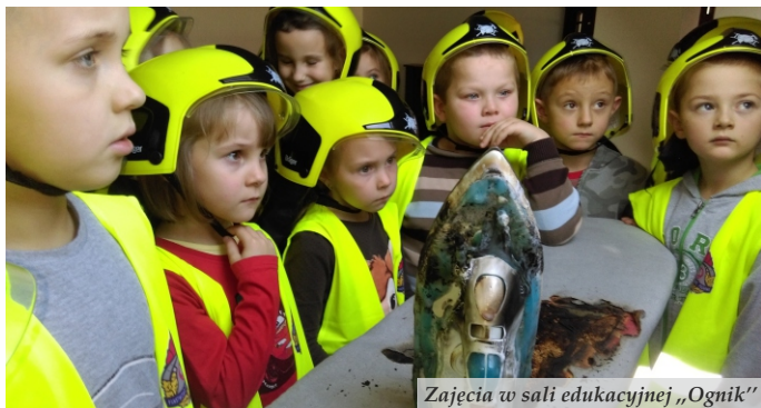
Zajęcia w sali edukacyjnej „Ognik”

W dniach 13 - 14 listopada br. w Szkole Podstawowej w Sarzynie odbył się turniej strażacki z udziałem 16 drużyn, zorganizowany w ramach projektu edukacyjnego „Od przedszkolaka do strażaka”.