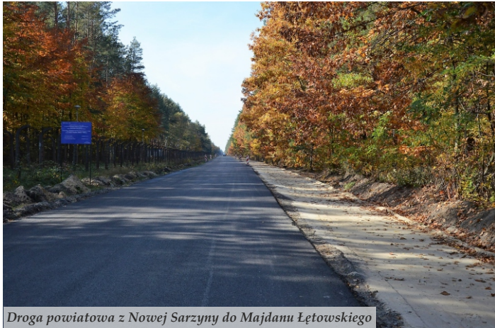
Droga powiatowa z Nowej Sarzyny do Majdanu Łętowskiego

● Ponad 110 zadań i projektów inwestycyjnych zostało zrealizowanych w tym roku na terenie Miasta i Gminy Nowa Sarzyna. Najwięcej środków wydatkowano na infrastrukturę drogową, której przebudowa zamknęła się w kwocie 21,5 mln zł. Pozwoliło to na wykonanie 21 km nowych nawierzchni asfaltowych, ponad 5 km chodników oraz zamontowania 115 lamp oświetleniowych.