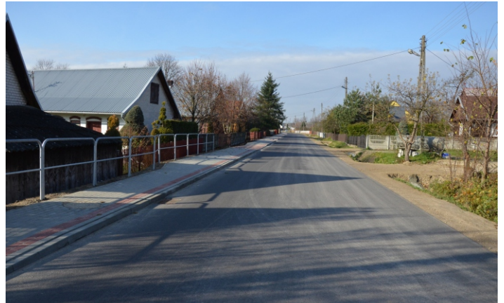
Nowo powstały chodnik i wyremontowana nawierzchnia drogi w Woli Zarczyckiej

● Pozostałe inwestycje z zakresu infrastruktury drogowej realizowane były samodzielnie przez nasz samorząd. Za kwotę 888 tys. zł przebudowano drogę gminną w Sarzynie „za wałem” przy wsparciu z PRGiPID w wysokości 379 tys. zł. W tej samej miejscowości w rejonie „zagroda” powstała nowa nawierzchnia drogi gminnej o wartości 612 tys. zł, z czego 389 tys. zł pochodziło z PROW na lata 2014-2020,