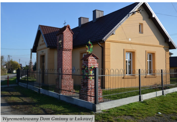
Wyremontowany Dom Gminny w Łukowej

przy szkole w Woli Zarczyckiej, która będzie kosztować 1,6 mln zł. Oba zadania uzyskały dofinansowanie z RPO WP na lata 2014-2020 w kwotach 973 tys. i 761 tys. zł. W trakcie realizacji jest także rozbudowa Szkoły Podstawowej w Rudzie Łańcuckiej, której wartość wyniesie 594 tys. zł. Wymieniono również ogrodzenie w tej placówce za kwotę 29 tys. zł. Przebudowano także ogrodzenia Szkoły Podstawowej w Nowej Sarzynie za kwotę 30 tys. zł oraz SP w Wólce Łętowskiej wraz z remontem budynku gospodarczego o wartości 81 tys. zł. W Tarnogórze wyremontowano dach budynku szkolnego za kwotę 56 tys. zł oraz zlecono opracowanie dokumentacji projektowej budowy sali gimnastycznej w tej placówce. Pozostałe remonty i zakupy wyposażenia w jednostkach oświatowych kosztowały ponad 200 tys. zł.