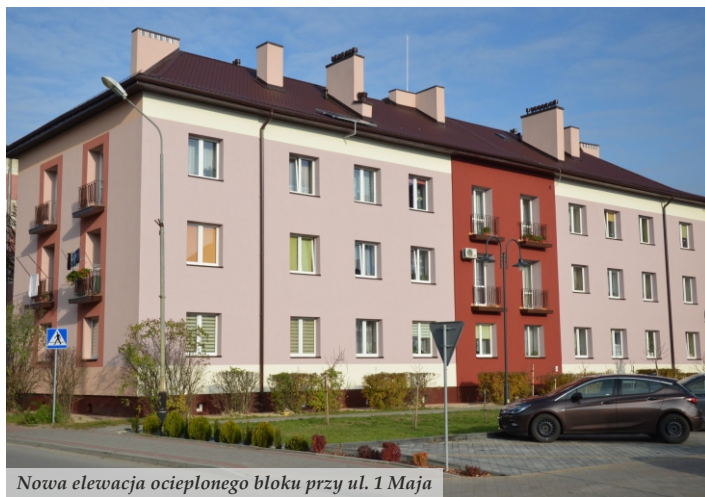
Nowa elewacja ocieplonego bloku przy ul. 1 Maja

wykonano sześć projektów o wartości 220 tys. zł. Obejmują one przebudowę terenów zielonych przy pl. 11 Listopada i ul. Konopnickiej, budowę ścieżek rowerowych, miejsc obsługi rowerzystów, przystani kajakowej na Trzebośnicy oraz zagospodarowania terenu sportowego za MOSiR-em. Wykonano także projekty przebudowy budynku remizy OSP w Łętowni na Dom Kultury, modernizacji filii bibliotek w Tarnogórze i Łętowni, przebudowy Domu Kultury w Woli Zarczyckiej oraz wykonania instalacji fotowoltaicznej dla MOSiR-u.