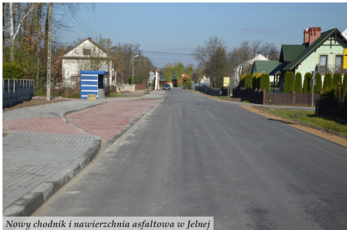
Nowy chodnik i nawierzchnia asfaltowa w Jelnej

● Ponad 110 zadań i projektów inwestycyjnych zostało zrealizowanych w tym roku na terenie Miasta i Gminy Nowa Sarzyna. Najwięcej środków wydatkowano na infrastrukturę drogową, której przebudowa zamknęła się w kwocie 21,5 mln zł. Pozwoliło to na wykonanie 21 km nowych nawierzchni asfaltowych, ponad 5 km chodników oraz zamontowania 115 lamp oświetleniowych.