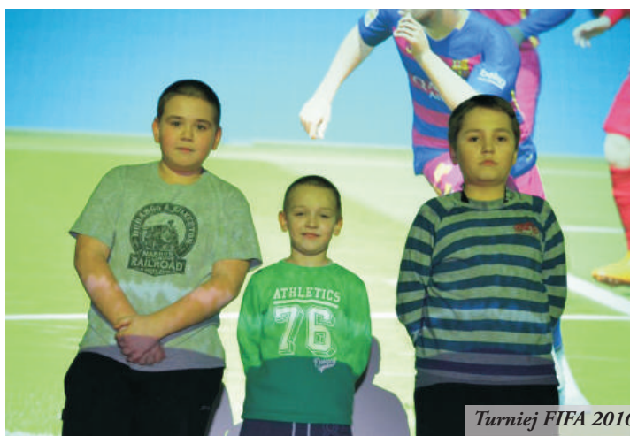
Turniej FIFA 2016 na ekranie kinowym