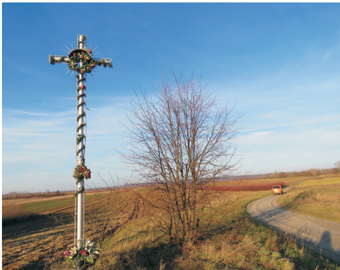
fragment tzw. „szlaku wołowego” w okolicy Trestkowej Góry, którym w 1656 r. ciągnęły na północ wojska Karola X Gustawa Wittelsbacha

Równo 360 lat temu w okolicach Sarzyny toczyły się partyzanckie potyczki ze szwedzkim najeźdźcą. Z zaprawioną w bojach armią Karola X Gustawa Wittelsbacha walczyły wojska polskie wspierane masowo przez pospolite ruszenie, w tym chłopów z Jelnej, Sarzyny, Woli Zarczyckiej, Tarnogóry i wielu innych okolicznych wiosek. Dzisiaj o tych bohaterach nikt nie pamięta. A szkoda, bo to jedna z piękniejszych kart naszej regionalnej historii.