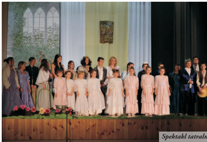
Spektakl teatralny „Jest taki kwiat”