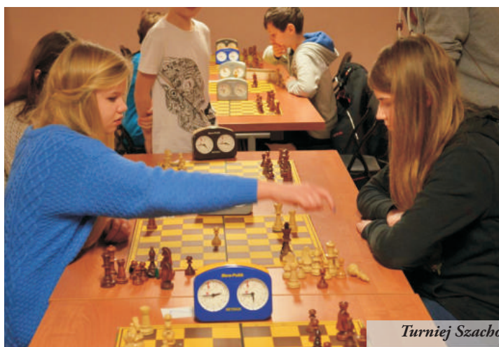
Turniej Szachowy „Zima 2016”