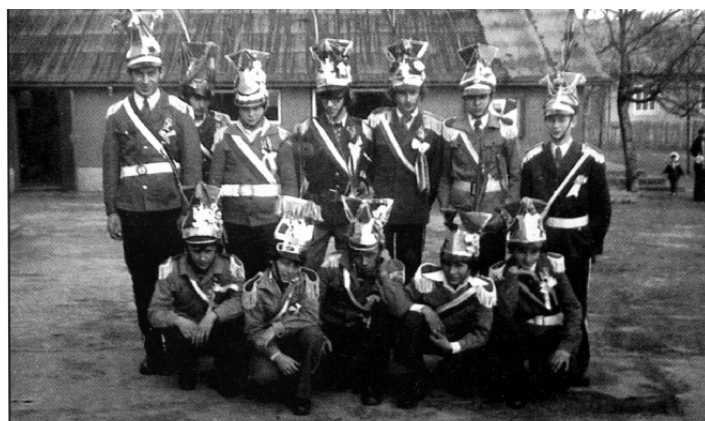
Straż Grobowa w Nowej Sarzynie, rok 1978

Po zmianach ustrojowych w Polsce rola Straży Grobowych na powrót kojarzona jest z liturgią kościelną, a nazwa „turki” używana sporadycznie, raczej tylko na użytek okolicznościowych parad, zaś wschodni, „turecki” strój zachował się zaledwie w kilku miejscach, m.in. w Wielkopolsce i na Podkarpaciu (Wola Rzeczycka, Radomyśl).