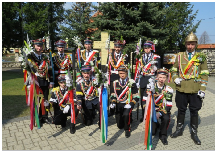
Straż Grobowa w Jelnej, rok 2016