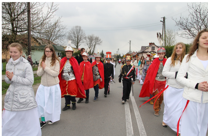
Sarzynskie „maryjki”, „rycerzyki” i „rzymianie”, rok 2015

Straże Grobowe dodają niezwykłego kolorytu Świętom Wielkanocnym. Jak wielkiego, można przekonać się podziwiając kolejne, masowe parady tych formacji, które odbywają się co roku w drugą niedzielę po Wielkiej Nocy, w coraz to w innych miejscowościach. Dla organizatorów to nie tylko promocja, ale też forma wyróżnienia. Widowiska te są okazją do zaprezentowania barwnych strojów, elementów musztry i spotkania się z podobnymi formacjami, często z odległych regionów kraju.