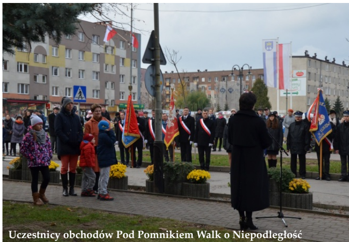
Uczestnicy obchodów Pod Pomnikiem Walk o Niepodległość