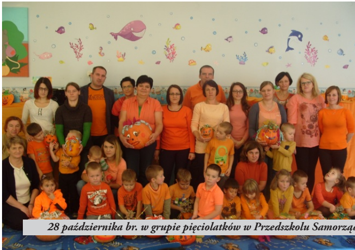
28 października br. w grupie pięciolatek w Przedszkolu Samorządowym „Niezapominajka” odbyło się „Święto dyni” z udziałem rodziców