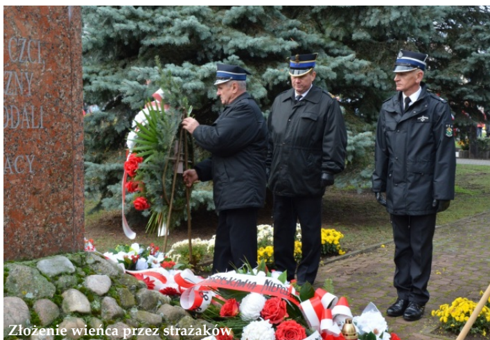
Złożenie wienca przez strażaków