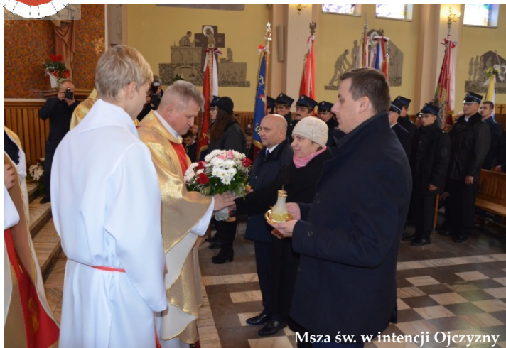
Msza św. w intencji Ojczyzny