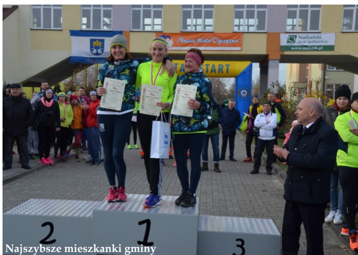
Najszybsze mieszkanki gminy