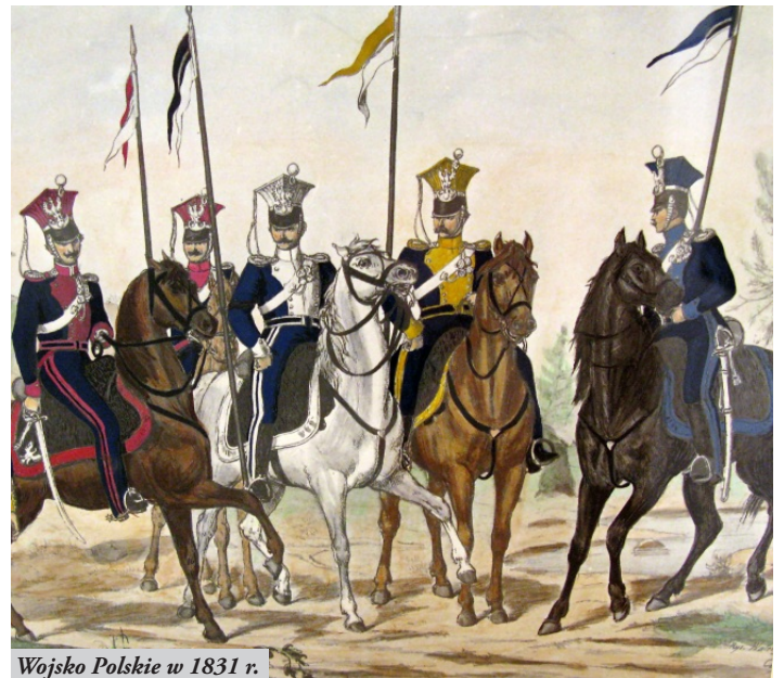
Wojsko Polskie w 1831 r.