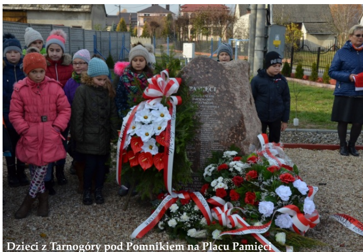
Dzieci z Tarnogóry pod Pomnikiem na Placu Pamięci