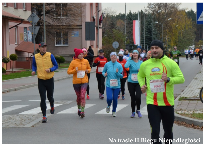
Na trasie II Biegu Niepodległości