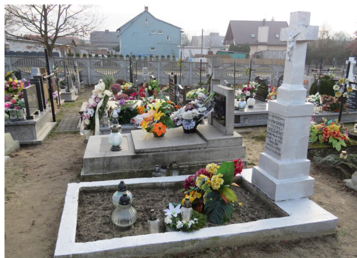
Grób zabitych sióstr na cmentarzu w Sarzynie (2019)