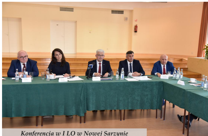
Konferencja w I LO w Nowej Sarzynie

3 września br. w auli I Liceum Ogólnokształcącego w Nowej Sarzynie odbyła się konferencja poświęcona wodorowi, który ma szansę stać się w przyszłości wiodącym „czystym” paliwem i wizytówką transformacji energetycznej XXI wieku.