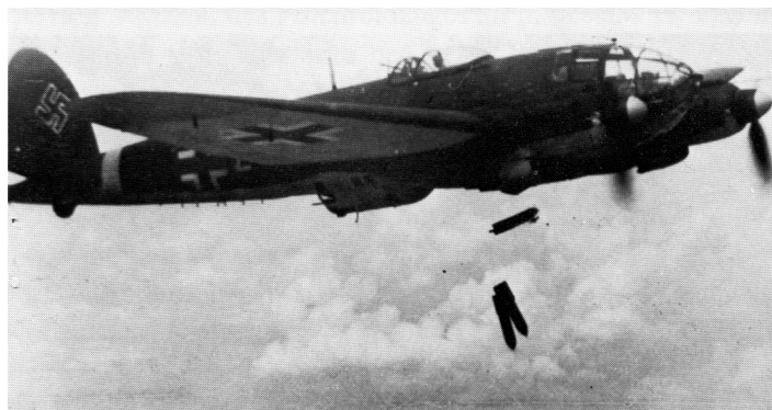
Fot. Niemiecki bombowiec He 111 P