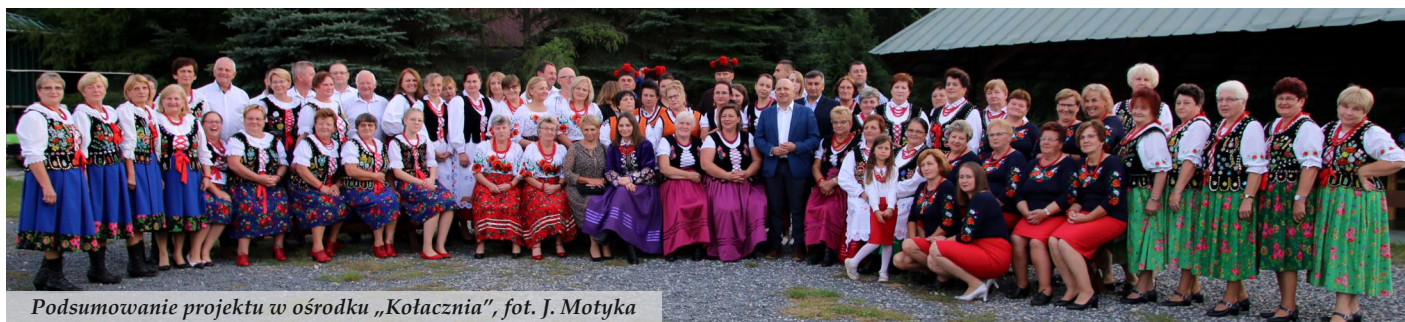
Podsumowanie projektu w ośrodku „Kołacznia”

Stowarzyszenie Gospodynie Razem zakończyło realizację projektu pod nazwą „Popularyzacja kultury ludowej przez KGW” dofinansowanego ze środków Ministerstwa Kultury, Dziedzictwa Narodowego i Sportu w ramach programu Narodowego Centrum Kultury „EtnoPolska 2021”.