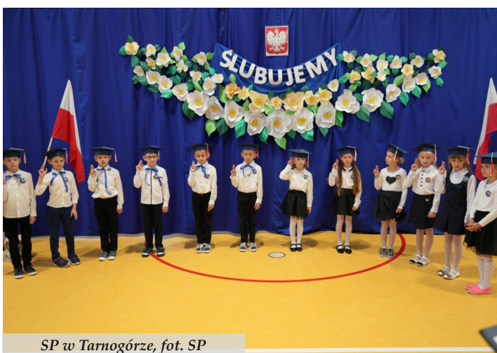
SP w Tarnogórze