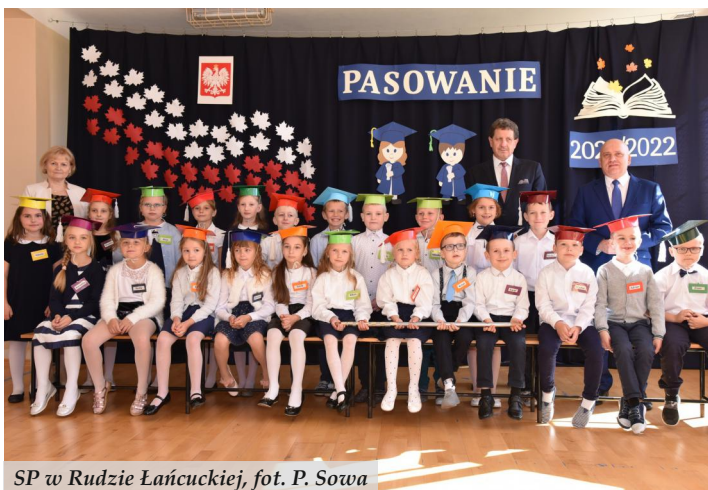
SP w Rudzie Łańcuckiej