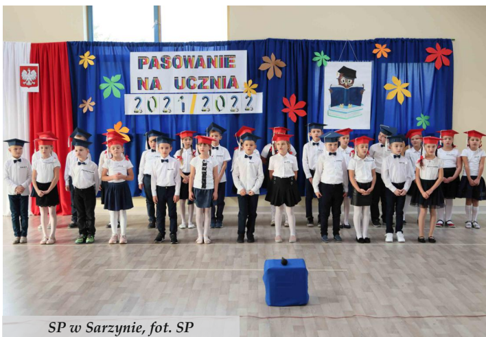
SP w Sarzynie