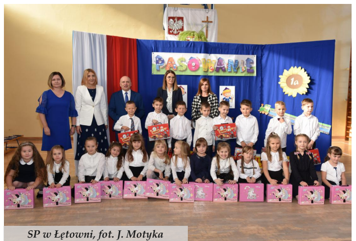
SP w Łętowni