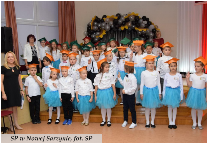
SP w Nowej Sarzynie