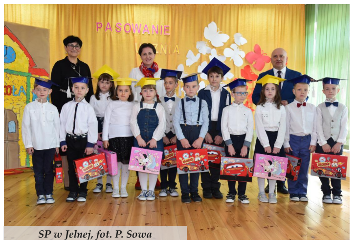
SP w Jelnej