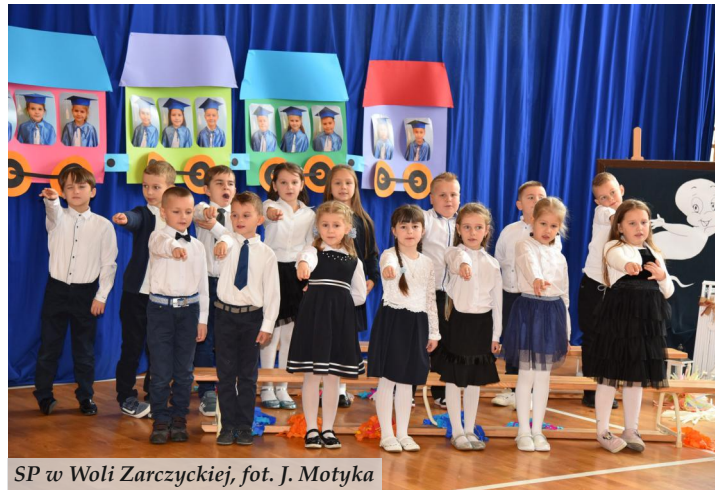
SP w Woli Zarzyczykiej