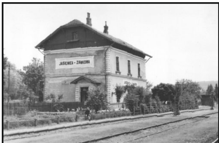
Stacja kolejowa w Jasienicy Zamkowej przed II wojną światową