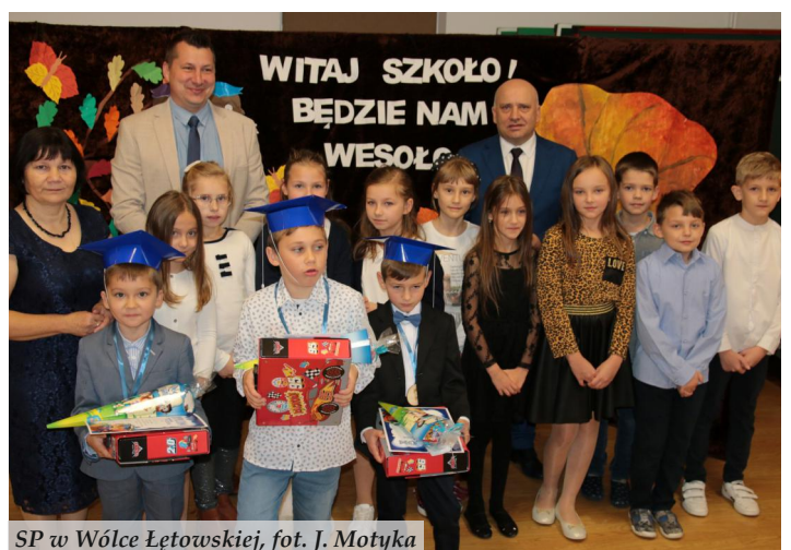
SP w Wólce Łętowskiej