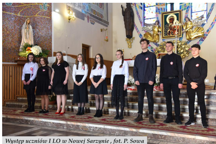
Występ uczniów I LO w Nowej Sarzynie