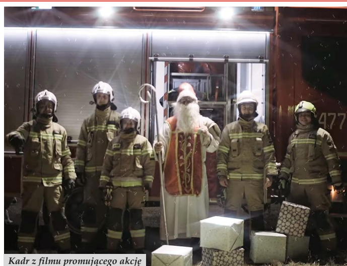
Kadr z filmu promującego akcję

Świąteczna akcja polega na zbiórce określonych artykułów, które następnie zostaną przekazane dla Hospicjum Dziecięcego w Rzeszowie. Lista potrzebnych artykułów dla podopiecznych fundacji