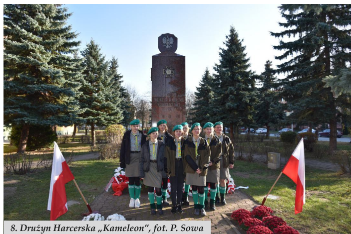
8. Drużyna Harcerska „Kameleon”