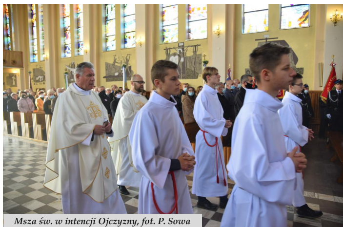
Msza św. w intencji Ojczyzny, fot. P. Sowa

11 listopada 1918 roku to jedna z najważniejszych dat w historii narodu polskiego, kiedy to po przeszło stu dwudziestu latach niewoli, Rzeczpospolita Polska znów stała się wolna i niepodległa. Odrodzenie się naszej Ojczyzny poprzedzone było wielką ofiarą i wysiłkiem naszych rodaków, którzy nigdy nie porzucili marzeń o wolności.