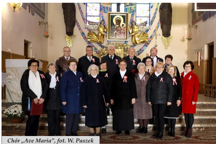
Chór „Ave Maria”

11 listopada 1918 roku to jedna z najważniejszych dat w historii narodu polskiego, kiedy to po przeszło stu dwudziestu latach niewoli, Rzeczpospolita Polska znów stała się wolna i niepodległa. Odrodzenie się naszej Ojczyzny poprzedzone było wielką ofiarą i wysiłkiem naszych rodaków, którzy nigdy nie porzucili marzeń o wolności.