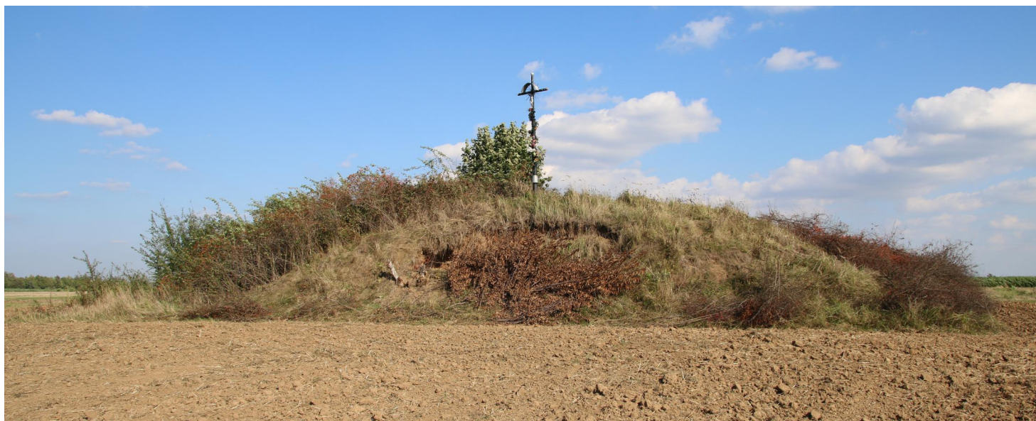
Widok ogólny na „Zbójenkę” rok 2015, przed „przebudową” kopca

Od wieków budzi emocje wśród miejscowej ludności, zaś dla turystów jest atrakcją. Z pokolenia na pokolenia przekazywane są legendy na jego temat. Nie poraża wysokością, leży zaledwie 169 m n.p.m. Zagadkowy kopiec w Sarzynie nad Sanem zwany potocznie „Zbójenką” być może ujawni swoje tajemnice. Naukowcy rozważają podjęcie badań archeologicznych tego obiektu.