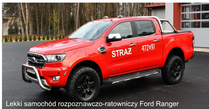
Lekki samochód rozpoznawczo-ratowniczy Ford Ranger