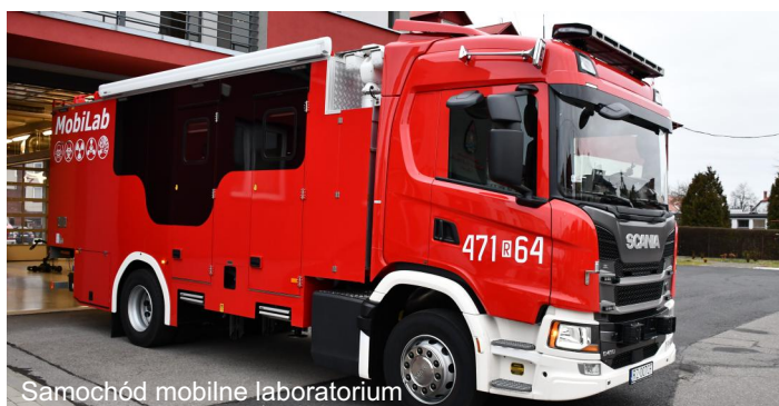
Samochód mobilne laboratorium

W Komendzie Powiatowej PSP w Leżajsku zakupiono dwa nowe pojazdy specjalne: średni samochód rozpoznania chemicznego „Mobilne laboratorium” Scania G410 oraz lekki samochód rozpoznawczo-ratowniczy Ford Ranger.