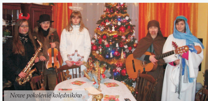
Nowe pokolenie kołędników

W drugi dzień Świąt Bożego Narodzenia kapela ludowa „Majdaniarze” odwiedziła wybranych mieszkańców z terenu Miasta i Gminy Nowa Sarzyna. Przy niecodziennych kołędnicach gromadziły się całe rodziny, chętnie włączając się do wspólnego śpiewu. Bardzo mile wspominamy te spotkania, bo w każdym domu przyjmowano nas serdecznie. Odwiedzenie gospodarstw z różnych zakątków naszej gminy wymaga sporo czasu i odpowiedniego przygotowania, dlatego co roku odwiedzamy dwanaście rodzin, które symbolizują dwanaście miesięcy kończącego się roku – powiedział prezes