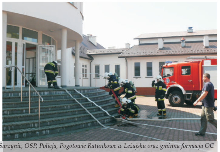
We wspólnych ćwiczeniach udział wzięli strażacy z PSP w Leżajsku, JRG w Nowej Sarzynie, OSP, Policja, Pogotowie Ratunkowe w Leżajsku oraz gminna formacja OC