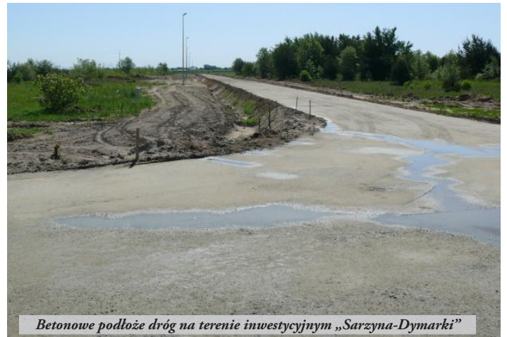
Betonowe podłoże dróg na terenie inwestycyjnym „Sarzyna-Dymarki”

● Rozstrzygnięto przetarg oraz podpisano umowę na budowę drogi wewnętrznej z parkingiem i chodnikiem na terenie Domu Kultury w Sarzynie. Prace potrwają do końca lipca br. Wartość zadania wyniesie 64 184 zł.