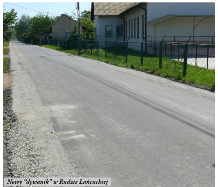
Nowy „dywanik” w Rudzie Łańcuckiej

● W Jelnej kontynuowana jest budowa stadionu sportowego na terenie Szkoły Podstawowej. Przed rozpoczęciem nowego roku szkolnego powstaną boiska do piłki nożnej, koszykówki, siatkówki, trybuny dla 200 osób oraz oświetlenie. Koszt inwestycji to blisko 300 000 zł.