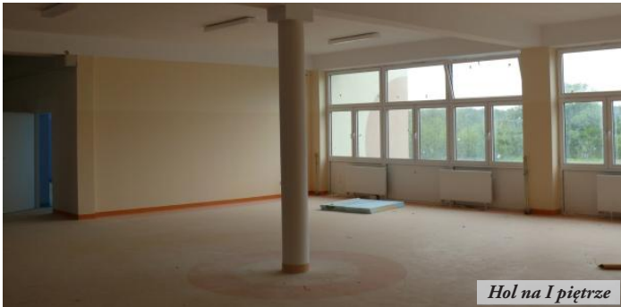
Hol na I piętrze