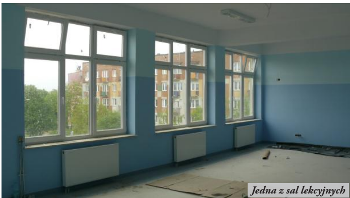
Jedna z sal lekcyjnych

● Dobiega końca budowa nowego budynku Gimnazjum w Nowej Sarzynie. W piwnicach umiejscowiono szatnie uczniowskie, pomieszczenia gospodarcze i techniczne. Na parterze budynku znajdują się: aula, stołówka, pokoje administracyjne oraz biblioteka. Na pierwszym piętrze zlokalizowano sale lekcyjne oraz pokój nauczycielski z kabinami do rozmów z rodzicami, zaś na drugim klasy i pracownię. Każda z kondygnacji posiada przestrzenne hole. Z myślą o osobach niepełnosprawnych zamontowano windę. Wykonano wszystkie instalacje, położono wykładziny i pomalowano sale lekcyjne. Obecnie trwają prace wykończeniowe i porządkowe oraz urządzenie terenu. Termin zakończenia inwestycji planowany jest na 30 czerwca, natomiast naukę w nowym obiekcie uczniowie Gimnazjum rozpoczną 1 września br.