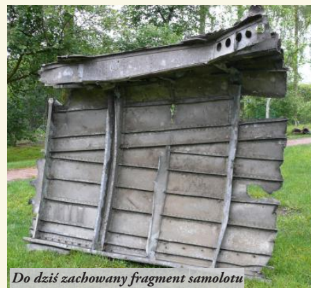
Do dziś zachowany fragment samolotu