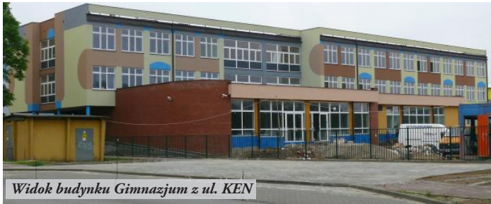
Widok budynku Gimnazjum z ul. KEN