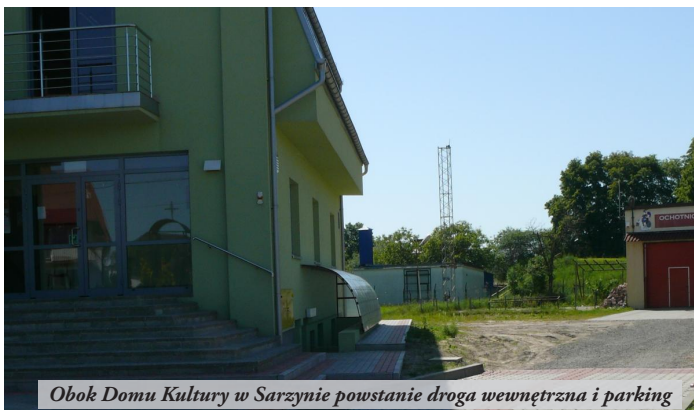
Obok Domu Kultury w Sarzynie powstanie droga wewnętrzna i parking

● Dobiega końca budowa nowego budynku Gimnazjum w Nowej Sarzynie. W piwnicach umiejscowiono szatnie uczniowskie, pomieszczenia gospodarcze i techniczne. Na parterze budynku znajdują się: aula, stołówka, pokoje administracyjne oraz biblioteka. Na pierwszym piętrze zlokalizowano sale lekcyjne oraz pokój nauczycielski z kabinami do rozmów z rodzicami, zaś na drugim klasy i pracownię. Każda z kondygnacji posiada przestrzenne hole. Z myślą o osobach niepełnosprawnych zamontowano windę. Wykonano wszystkie instalacje, położono wykładziny i pomalowano sale lekcyjne. Obecnie trwają prace wykończeniowe i porządkowe oraz urządzenie terenu. Termin zakończenia inwestycji planowany jest na 30 czerwca, natomiast naukę w nowym obiekcie uczniowie Gimnazjum rozpoczną 1 września br.