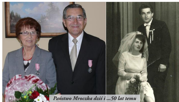
Państwo Mrocza dziś i ...50 lat temu