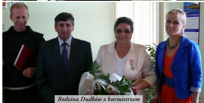
Rodzina Dudków z burmistrzem