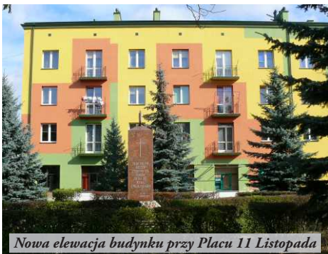
Nowa elewacja budynku przy Placu 11 Listopada

murów straty ciepła są tak duże, że audytor zalecił docieplenie ścian styropianem o grubości 14 cm oraz stropu styropianem o grubości 17 cm.