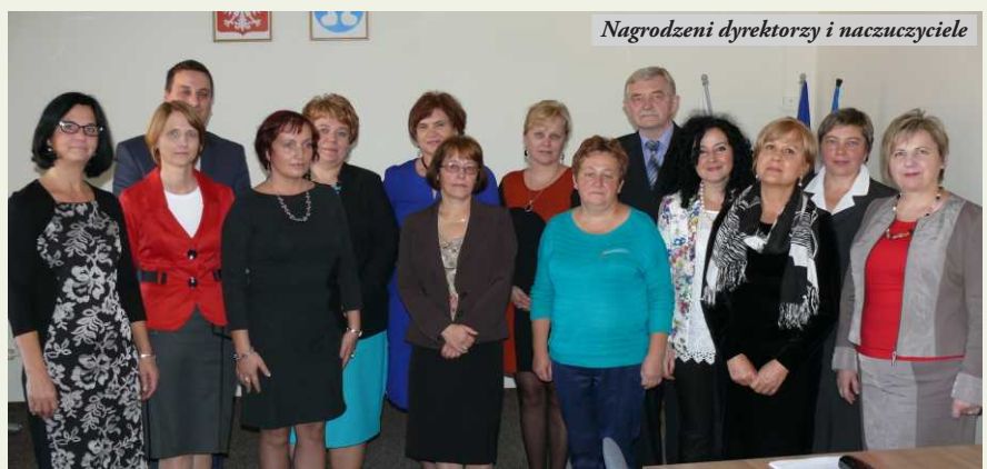
Nagrodzeni dyrektorzy i nauczyciele