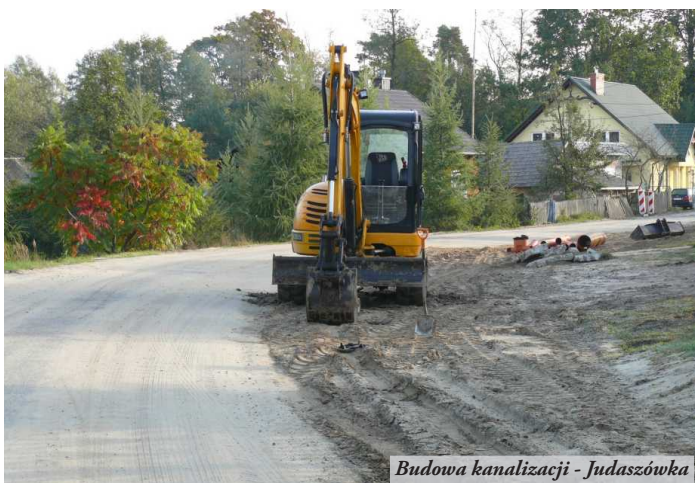
Budowa kanalizacji - Judaszówka

● W Nowej Sarzynie za budynkiem MOSiR-u dobiega końca budowa kompleksu sportowego „Moje Boisko - Orlik 2012” Gotowa jest już najważniejsza część, czyli dwa boiska - piłkarskie ze sztuczną nawierzchnią i wielofunkcyjne do innych gier zespołowych, a także oświetlenie, chodniki, przyłącza sanitarne i energetyczne. Do końca października potrwają prace końcowe przy budynku szatni i ogrodzeniu obiektu. Wartość inwestycji wynosi 1 056 000 zł. Na to zadanie gmina pozyskała dofinansowanie z Ministerstwa Sportu i Turystyki w wysokości 500 000 zł oraz z Urzędu Marszałkowskiego Województwa Podkarpackiego w Rzeszowie w kwocie 333 000 zł. Budowę kompleksu sportowego wsparły także okoliczne przedsiębiorstwa: Elektrociepłownia Nowa Sarzyna Sp. z o.o. (30 000 zł), Maante Sp. z o.o., (20 000 zł) oraz Zakłady Chemiczne „Organika-Sarzyna” (15 000 zł).