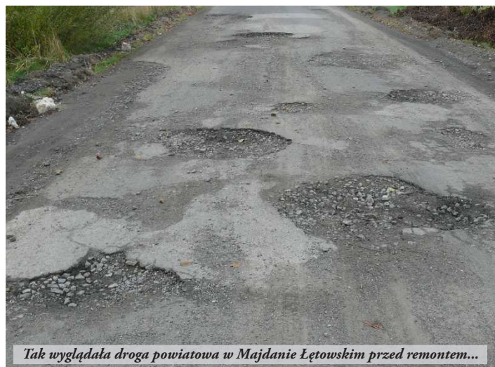
Tak wyglądała droga powiatowa w Majdanie Łętowskim przed remontem...