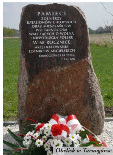
Obelisk w Tarnogórze

oprac. Piotr Sowa - na podstawie materiałów zebranych przez Grzegorza Kusiaka