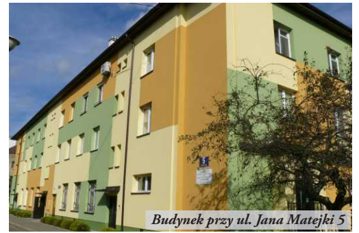
Budynek przy ul. Jana Matejki 5