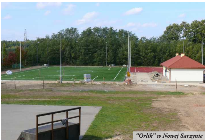
„Orlik” w Nowej Sarzynie

● W Nowej Sarzynie za budynkiem MOSiR-u dobiega końca budowa kompleksu sportowego „Moje Boisko - Orlik 2012” Gotowa jest już najważniejsza część, czyli dwa boiska - piłkarskie ze sztuczną nawierzchnią i wielofunkcyjne do innych gier zespołowych, a także oświetlenie, chodniki, przyłącza sanitarne i energetyczne. Do końca października potrwają prace końcowe przy budynku szatni i ogrodzeniu obiektu. Wartość inwestycji wynosi 1 056 000 zł. Na to zadanie gmina pozyskała dofinansowanie z Ministerstwa Sportu i Turystyki w wysokości 500 000 zł oraz z Urzędu Marszałkowskiego Województwa Podkarpackiego w Rzeszowie w kwocie 333 000 zł. Budowę kompleksu sportowego wsparły także okoliczne przedsiębiorstwa: Elektrociepłownia Nowa Sarzyna Sp. z o.o. (30 000 zł), Maante Sp. z o.o., (20 000 zł) oraz Zakłady Chemiczne „Organika-Sarzyna” (15 000 zł).