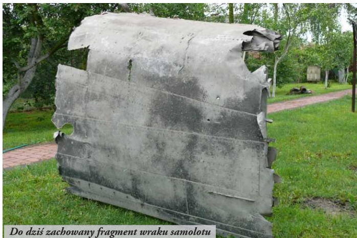
Do dziś zachowany fragment wraku samolotu