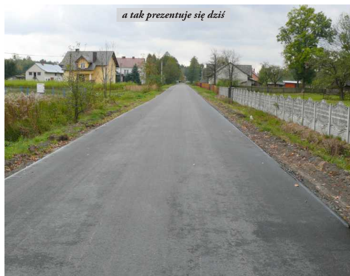
a tak prezentuje się dziś